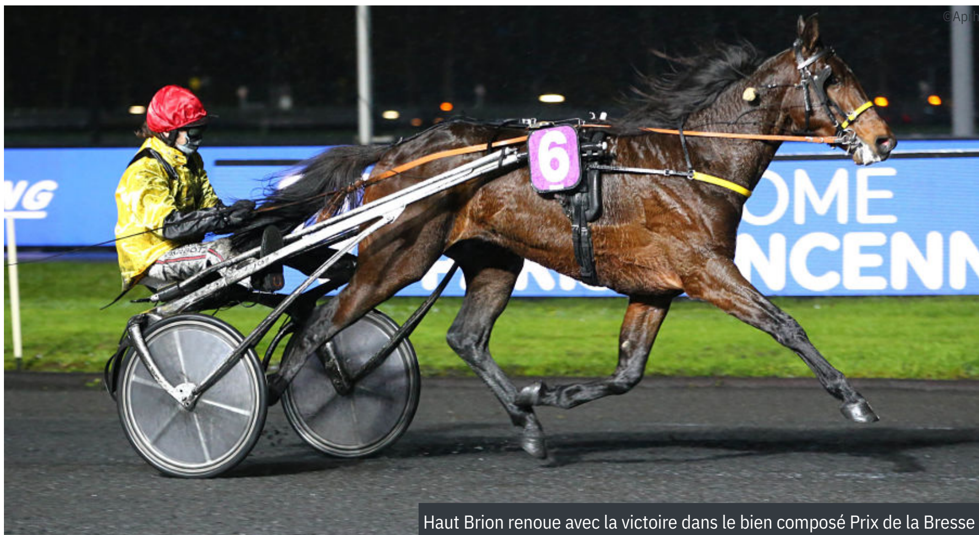
Haut Brion renoue avec la victoire dans le bien composé Prix de la Bresse

4 e : Fly des Andiers - 5 e : Fantomas Turgot - 6 e : Filou du Palais - 7 e : Forzo Desjy