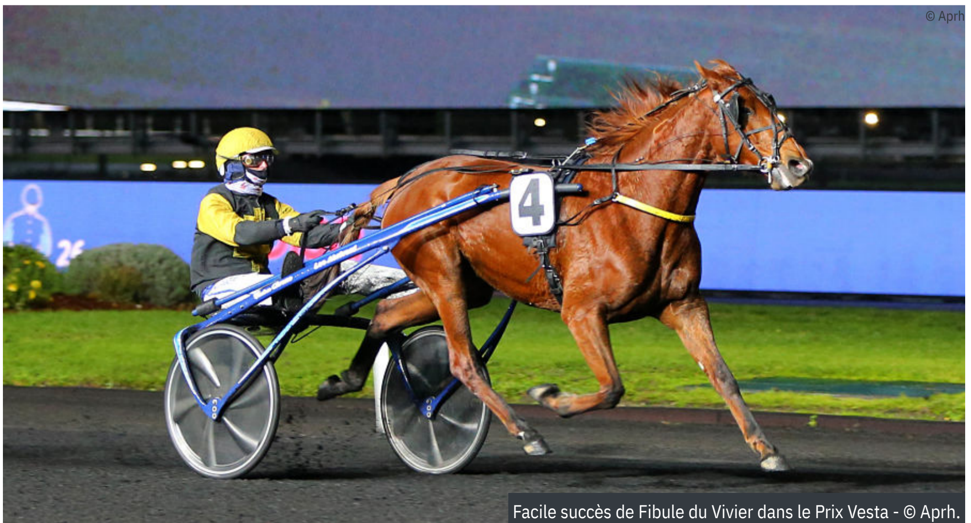
Facile succès de Fibule du Vivier dans le Prix Vesta