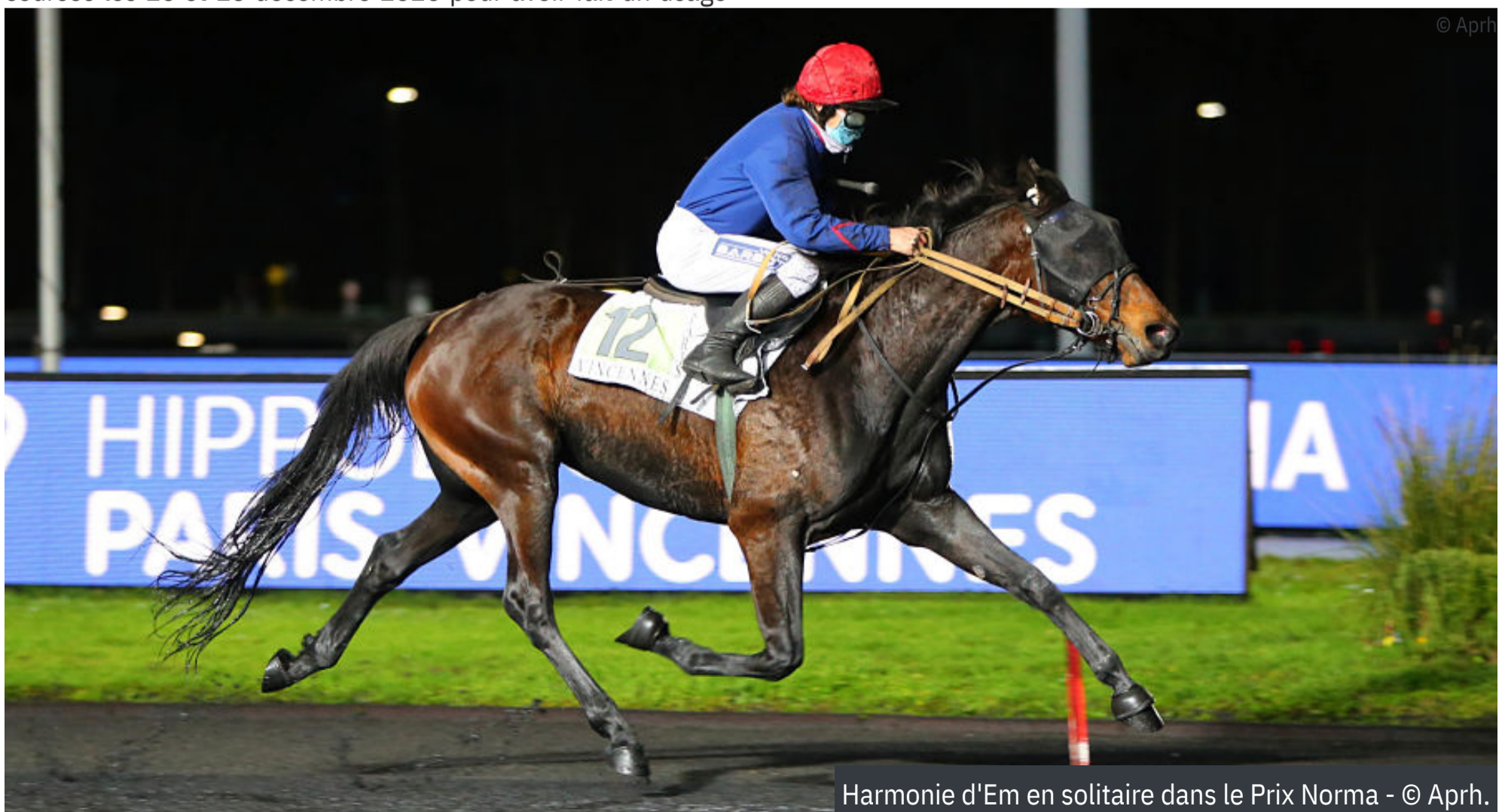
Harmonie d'Em en solitaire dans le Prix Norma

En outre, ils lui ont interdit de monter dans toutes les courses du 17 au 20 décembre 2020 inclus pour s'être déporté vers la corde, pendant le parcours, gênant la pouliche HOPE DU LOUVAIN qui a commis une faute d'allures et a été disqualifiée.