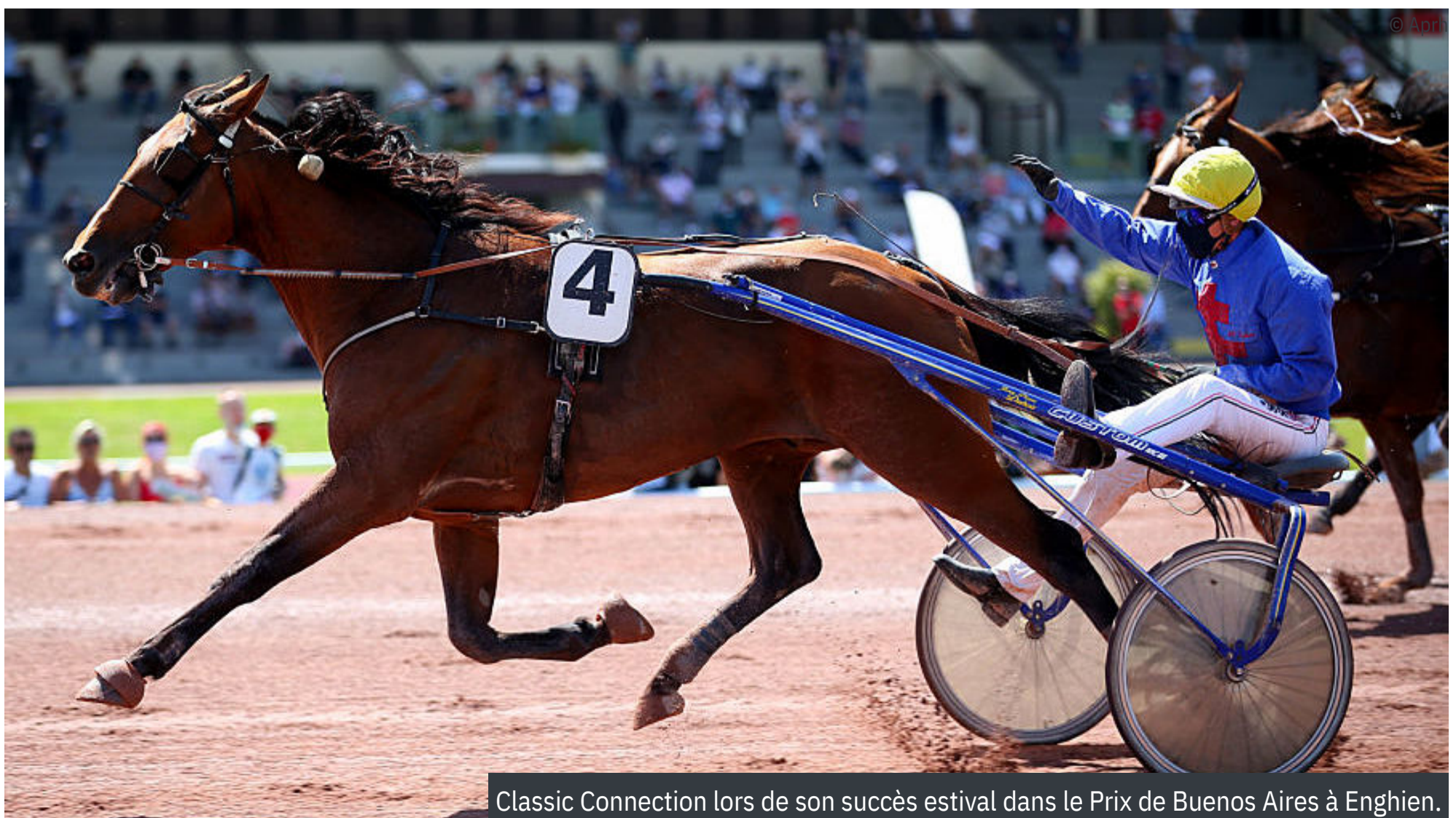
Classic Connection lors de son succès estival dans le Prix de Buenos Aires à Enghien.