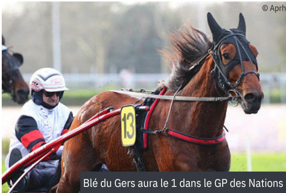
Blé du Gers aura le 1 dans le GP des Nations