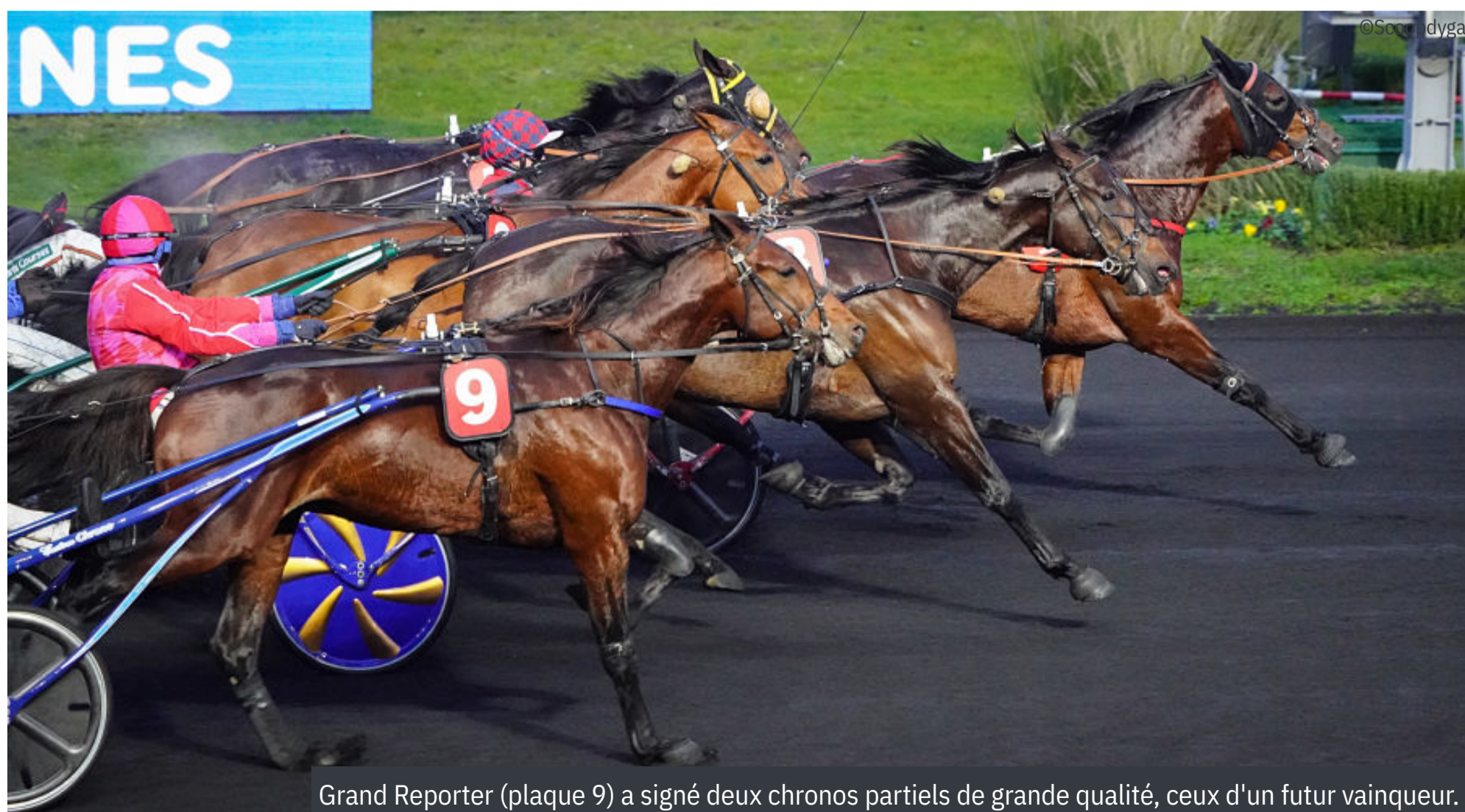
Grand Reporter (plaque 9) a signé deux chronos partiels de grande qualité, ceux d'un futur vainqueur.

* Tous les chronos affichés sont calculés en fonction de la distance parcourue réelle par chaque cheval / source tracking