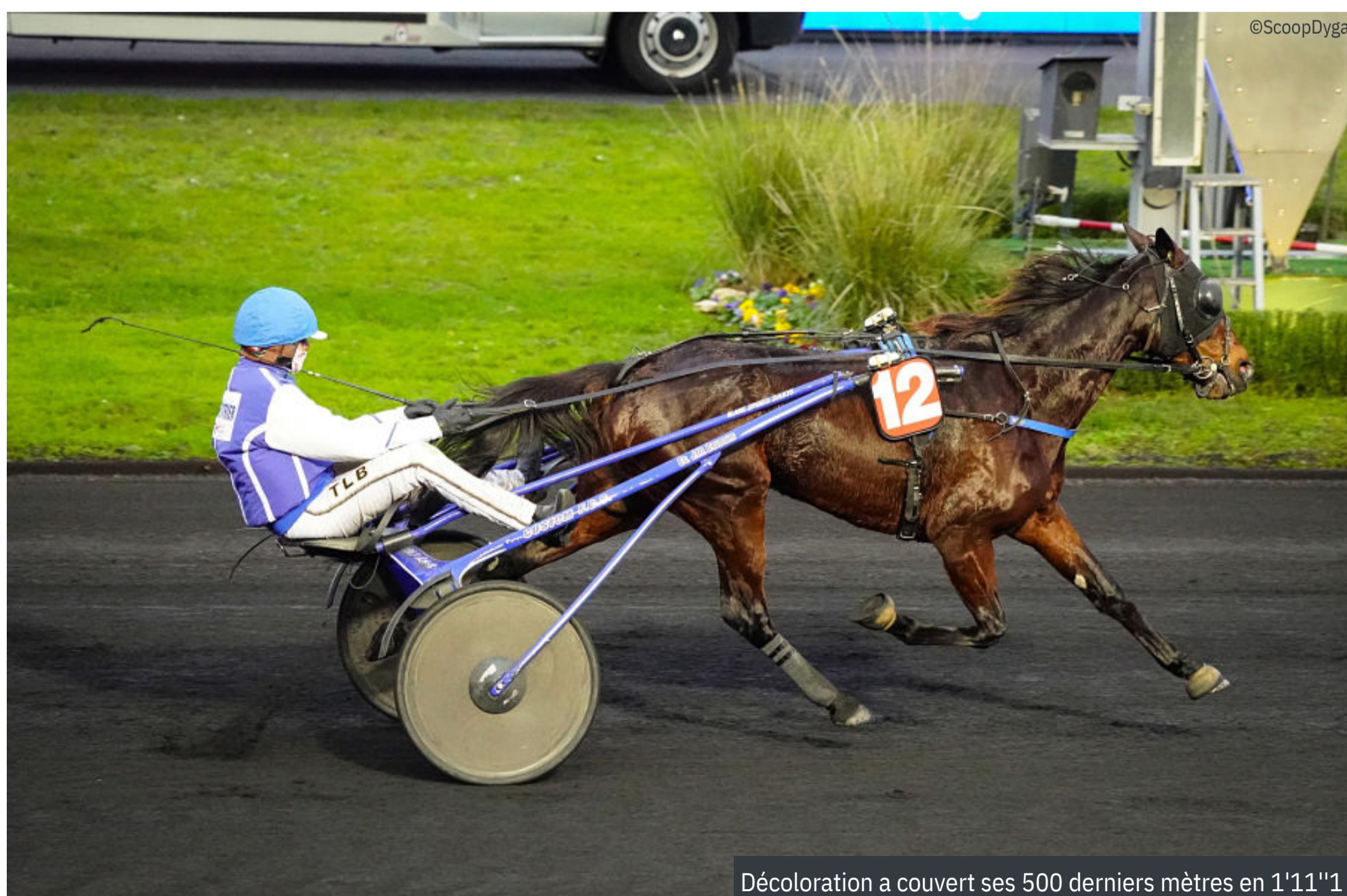
Décoloration a couvert ses 500 derniers mètres en 1'11"1

* Tous les chronos affichés sont calculés en fonction de la distance parcourue réelle par chaque cheval / source tracking