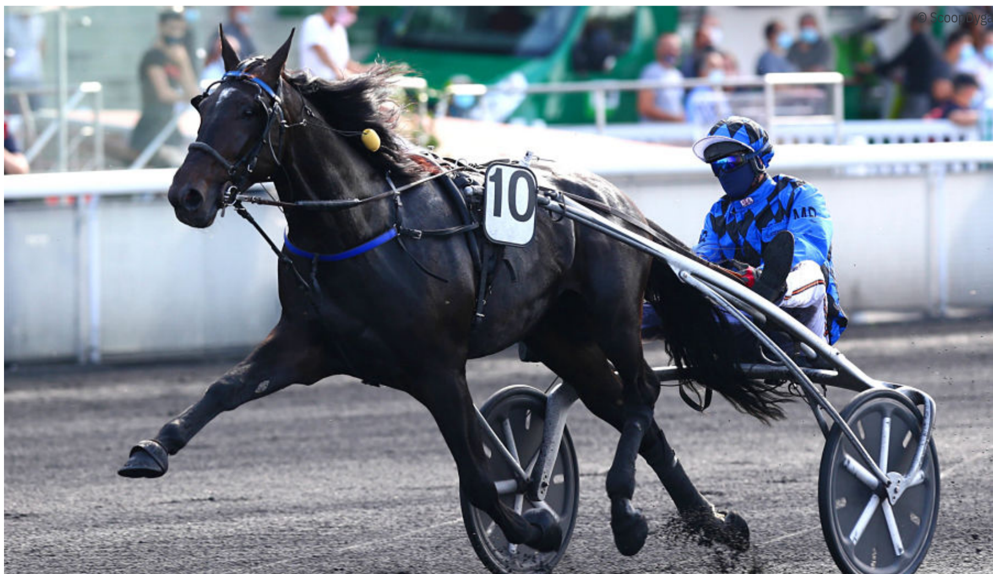
Ghisoni (410) : huit victoires consécutives et une deuxième place en neuf tentatives en 2020 - © ScoopDyga.