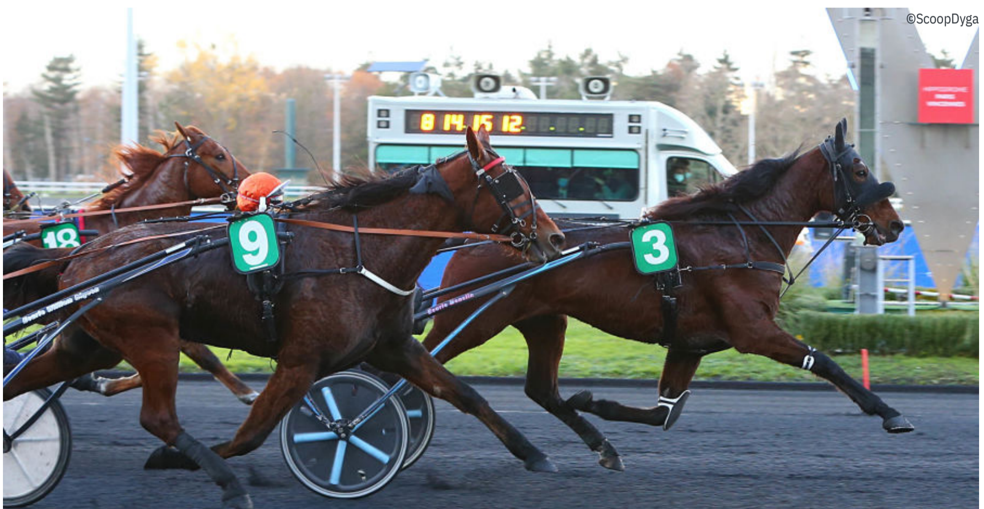
Gagnant (3) porte bien son nom dans le Prix de Lussac qu'il remporte aux dépens de Ganymède de Dussac (9)