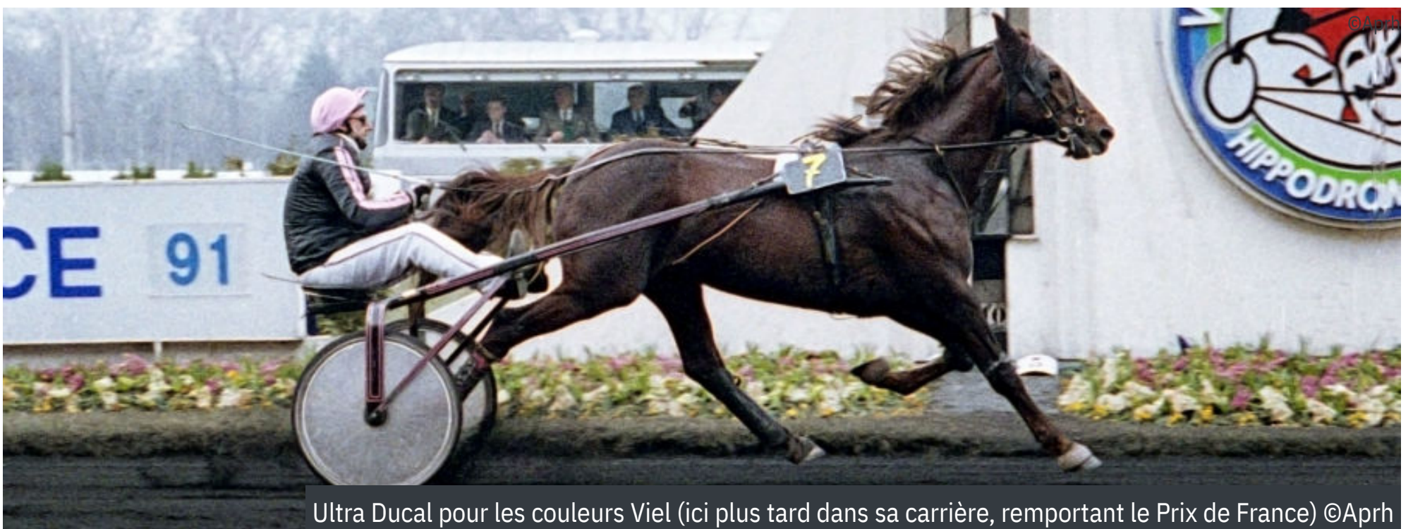
Ultra Ducal pour les couleurs Viel (ici plus tard dans sa carrière, remportant le Prix de France)

“ BUVETIER D'AUNOU ÉTAIT LE PREMIER VAINQUEUR DU CRITÉRIUM DES 3 ANS À DESCENDRE SOUS LA BARRE DE 1'18" 99 ”