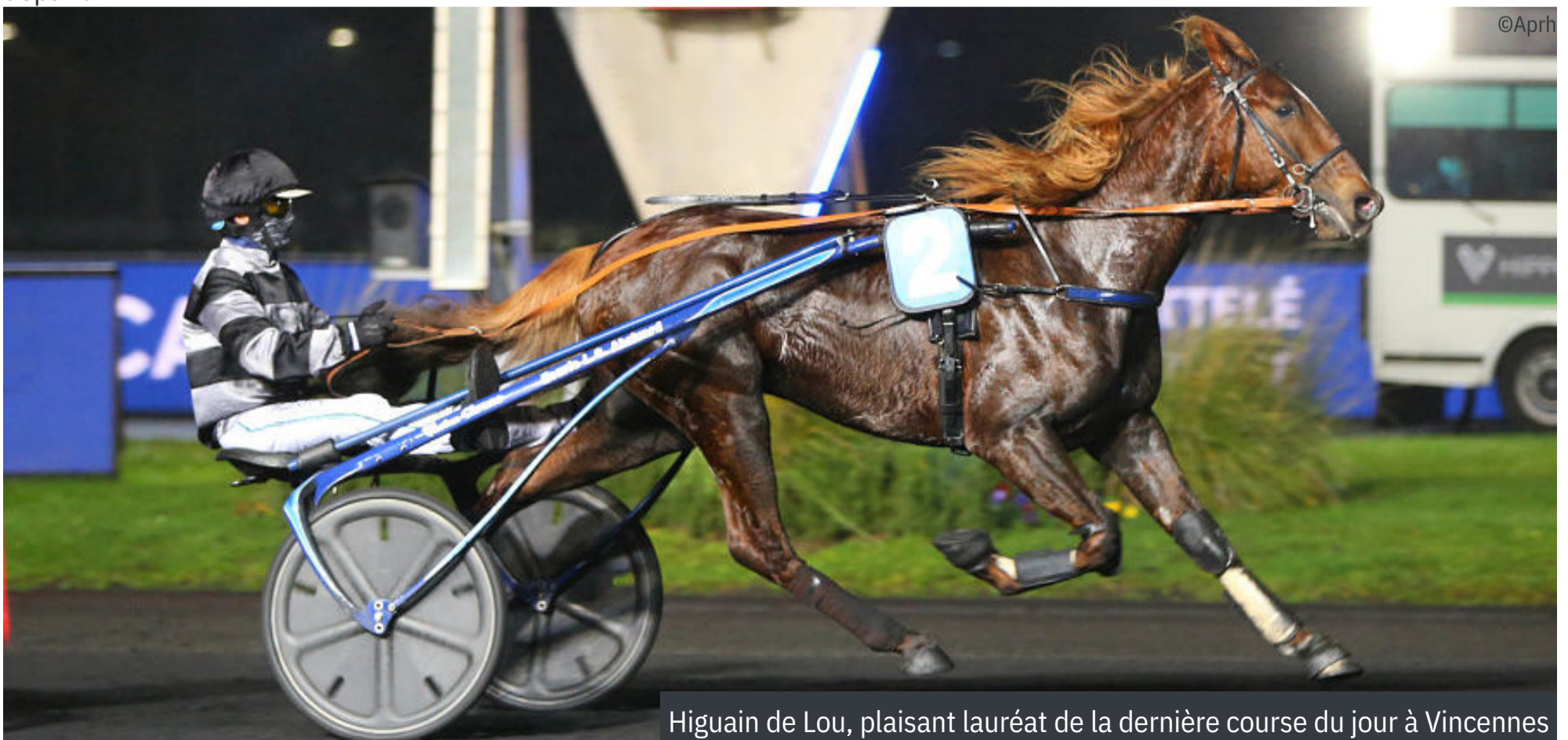
Higuain de Lou, plaisant lauréat de la dernière course du jour à Vincennes

Les Commissaires, après avoir entendu le jockey Louis BAUDOUIN en ses explications, lui ont interdit de monter dans toutes les courses les 2 et 3 janvier 2021 pour s'être déporté vers l'extérieur de la piste, pendant le parcours, gênant le cheval HERACLES DU MONT.