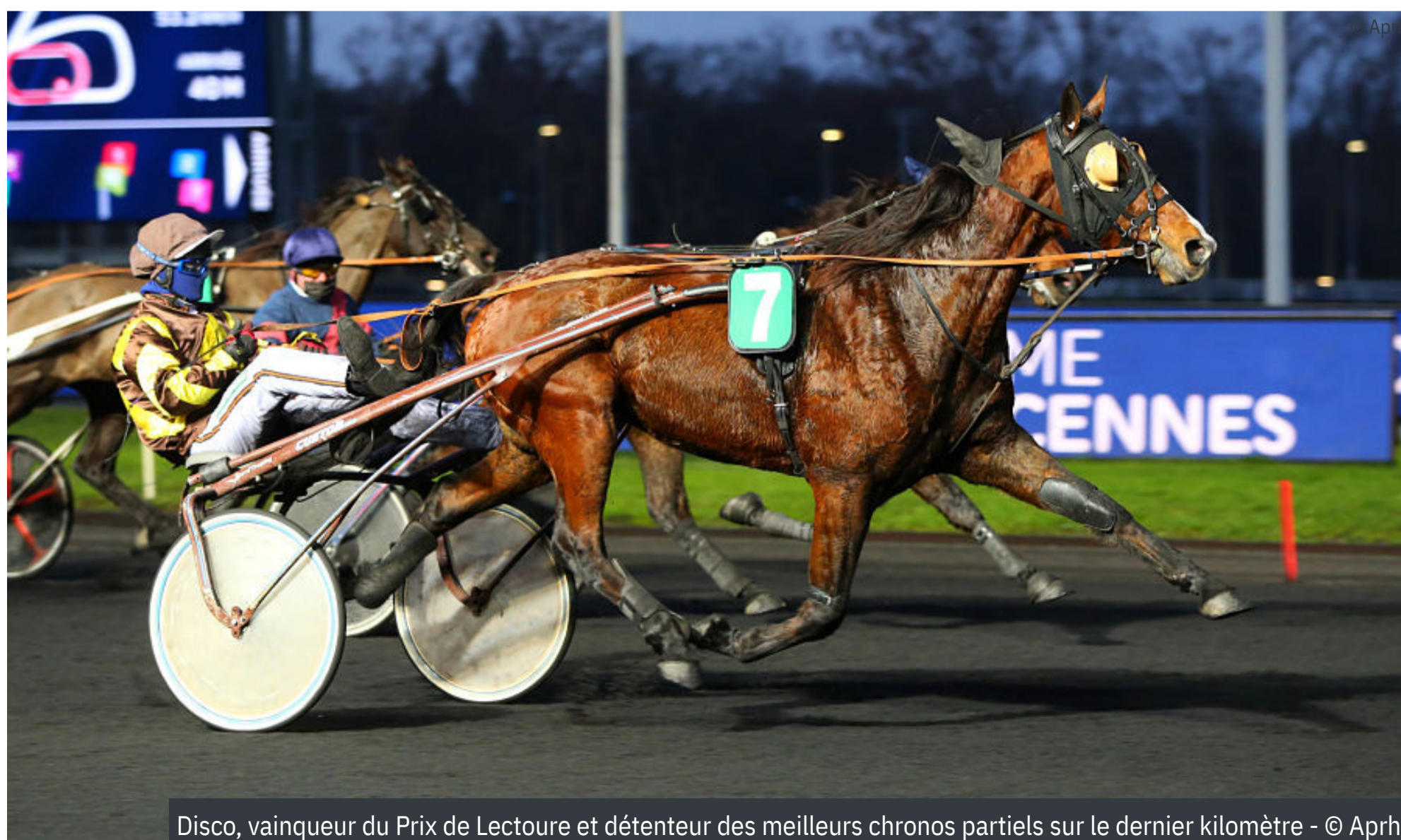
Disco, vainqueur du Prix de Lectoure et détenteur des meilleurs chronos partiels sur le dernier kilomètre

* Tous les chronos affichés sont calculés en fonction de la distance parcourue réelle par chaque cheval / source tracking