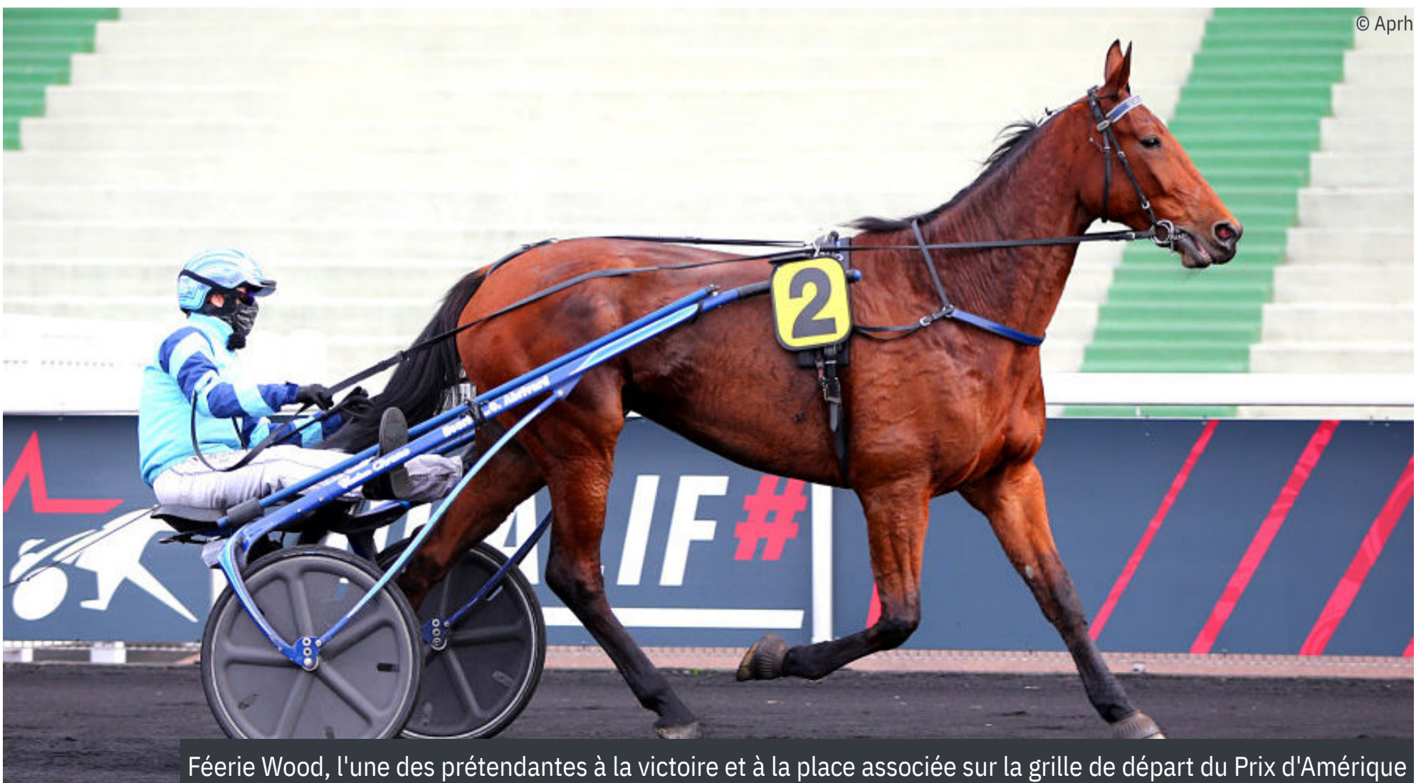
Féerie Wood, l'une des prétendantes à la victoire et à la place associée sur la grille de départ du Prix d'Amérique