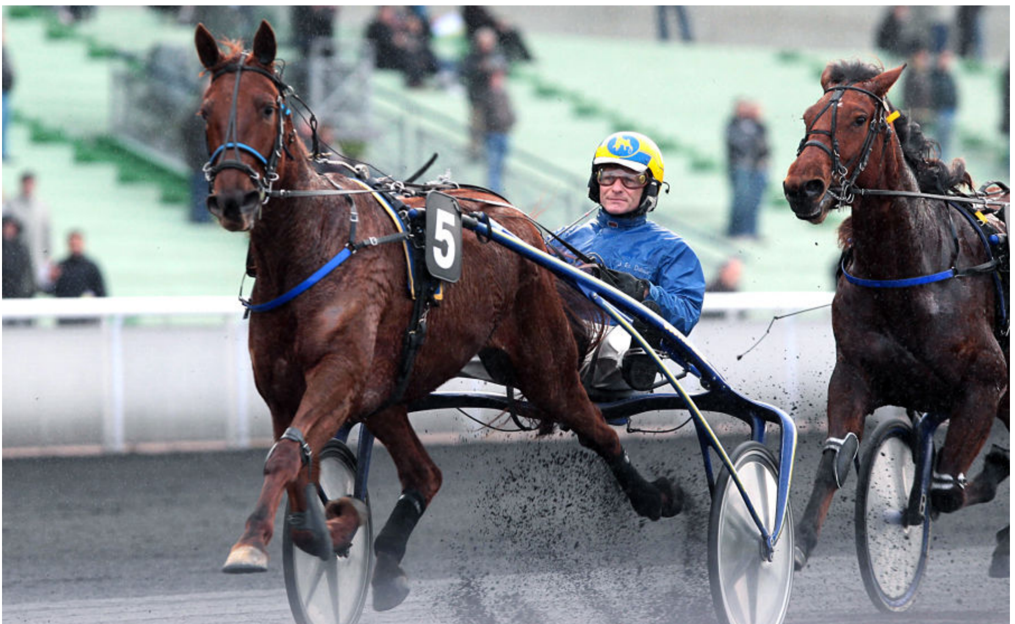
Ultimate Jet, fille de Delmonica Jet et mère d'Hanna des Molles, ici lors d'un succès à Vincennes en 2012

“HANNA DES MOLLES OFFRE À LA DESCENDANCE DE DELMONICA JET SON SEPTIÈME GROUPE 1 ET SON DEUXIÈME VAINQUEUR DE CRITÉRIUM.”