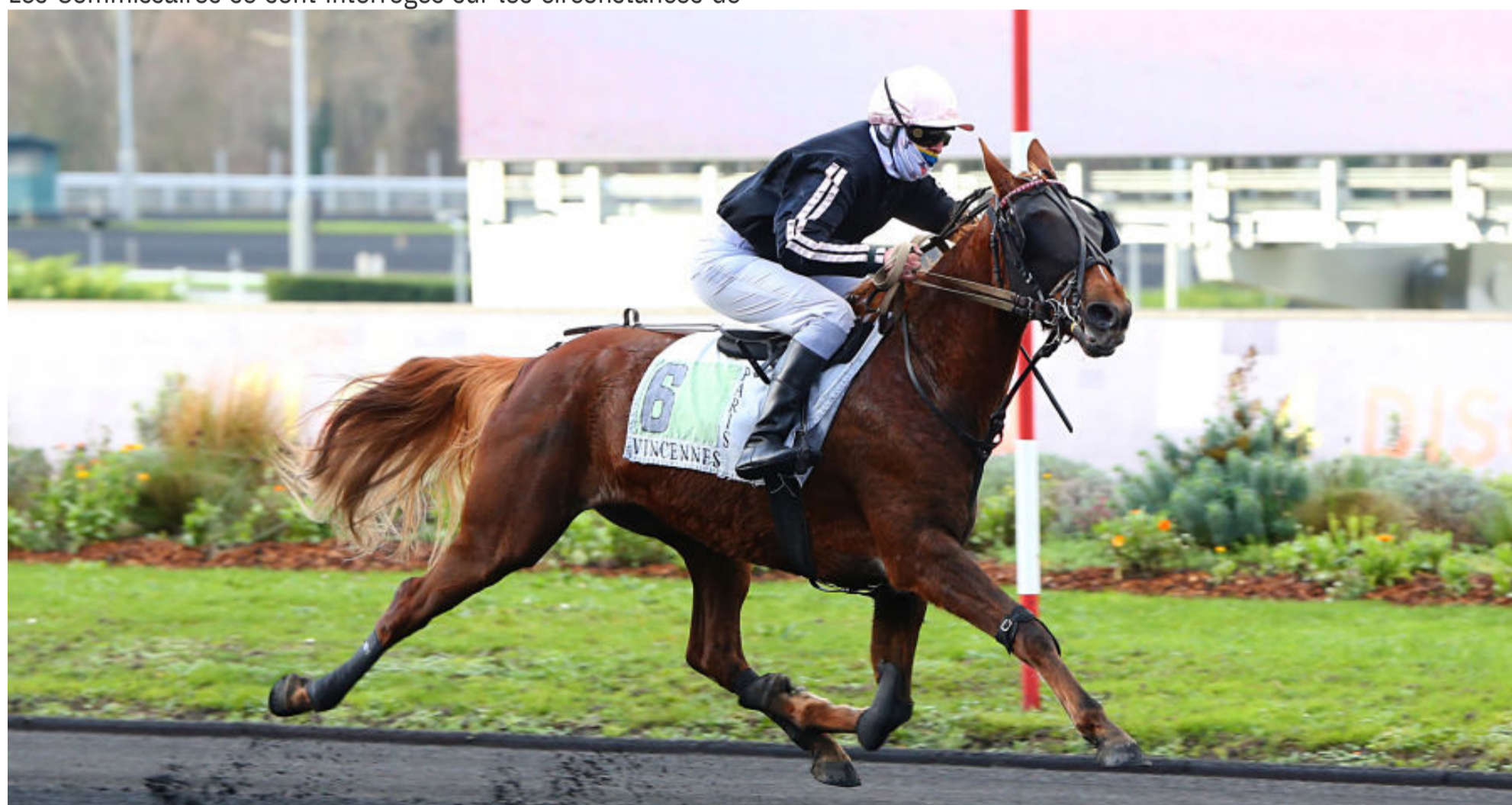
Gloire Joyeuse remporte avec autorité le Prix de Château-Thierry, signant pour l'occasion son premier succès à Vincennes

Aucune faute professionnelle n'a été retenue.