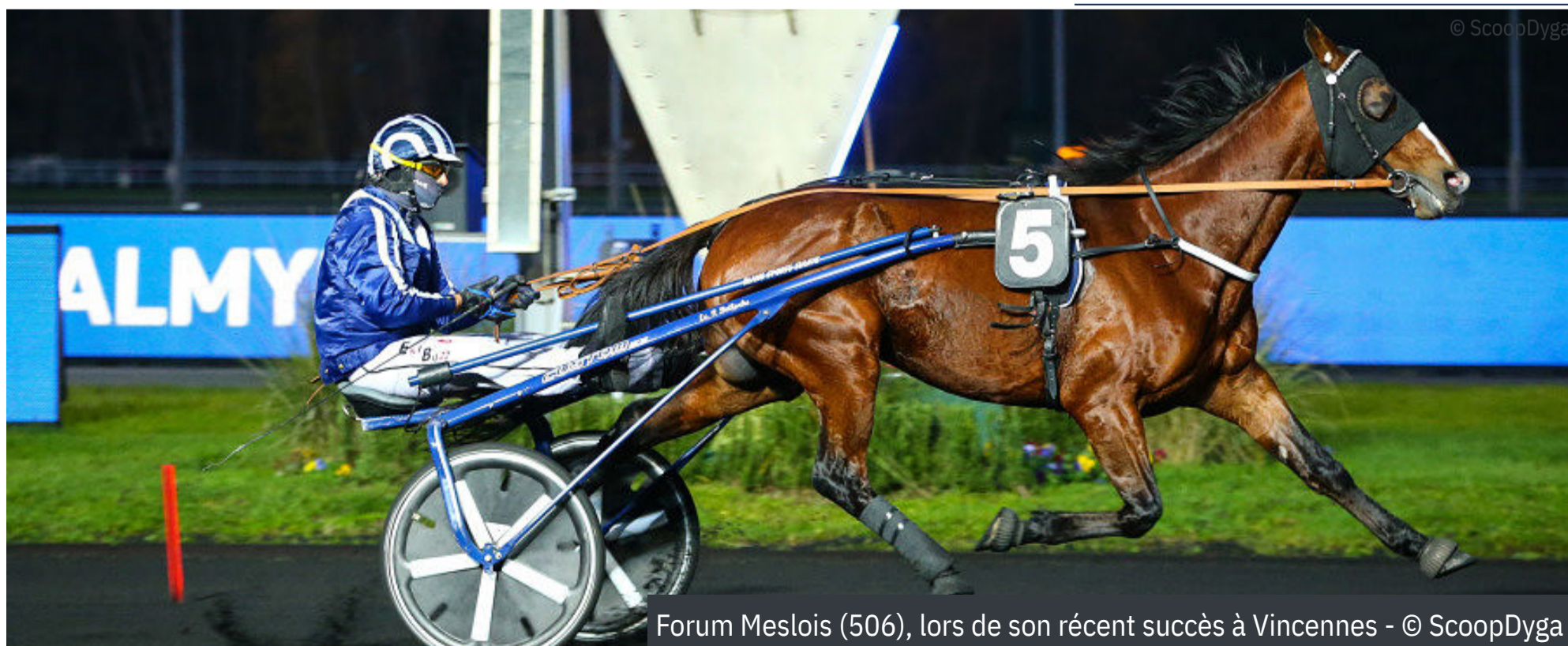
Forum Meslois (506), lors de son récent succès à Vincennes