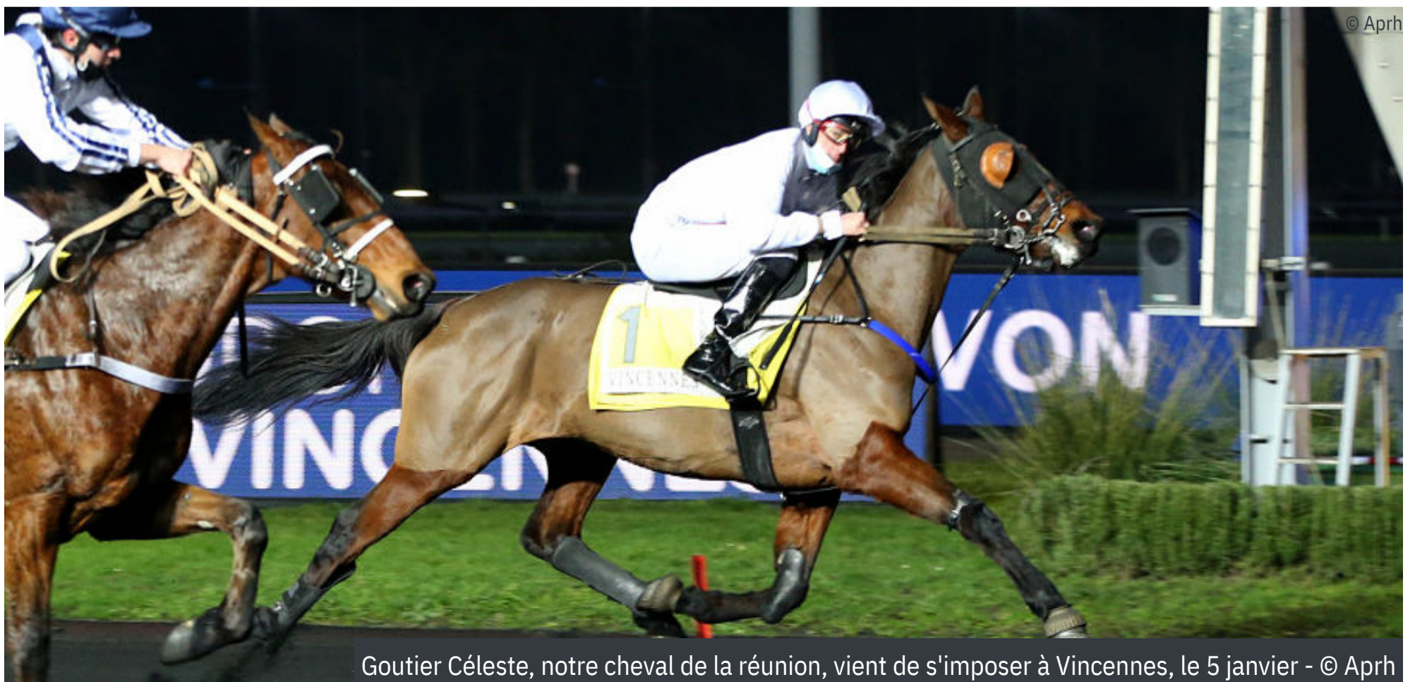
Goutier Céleste, notre cheval de la réunion, vient de s'imposer à Vincennes, le 5 janvier