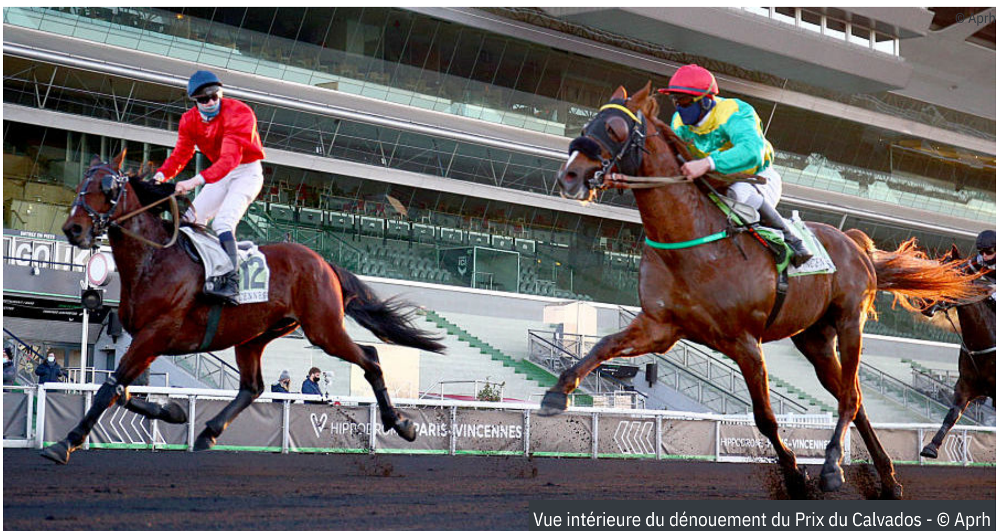
Vue intérieure du dénouement du Prix du Calvados