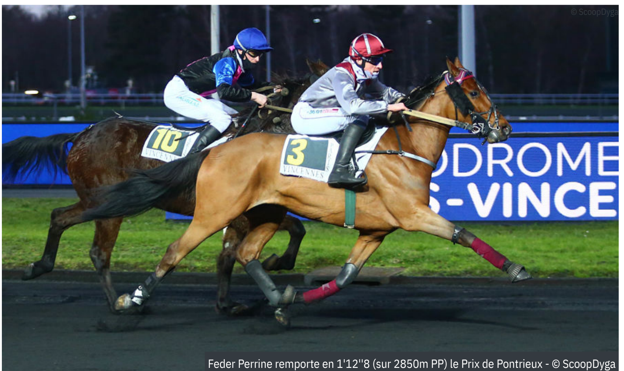
Feder Perrine remporte en 1'12"8 (sur 2850m PP) le Prix de Pontrieux

4 e : Filwell - 5 e : Forto Deo - 6 e : Farouk du Guelier - 7 e : First Gede