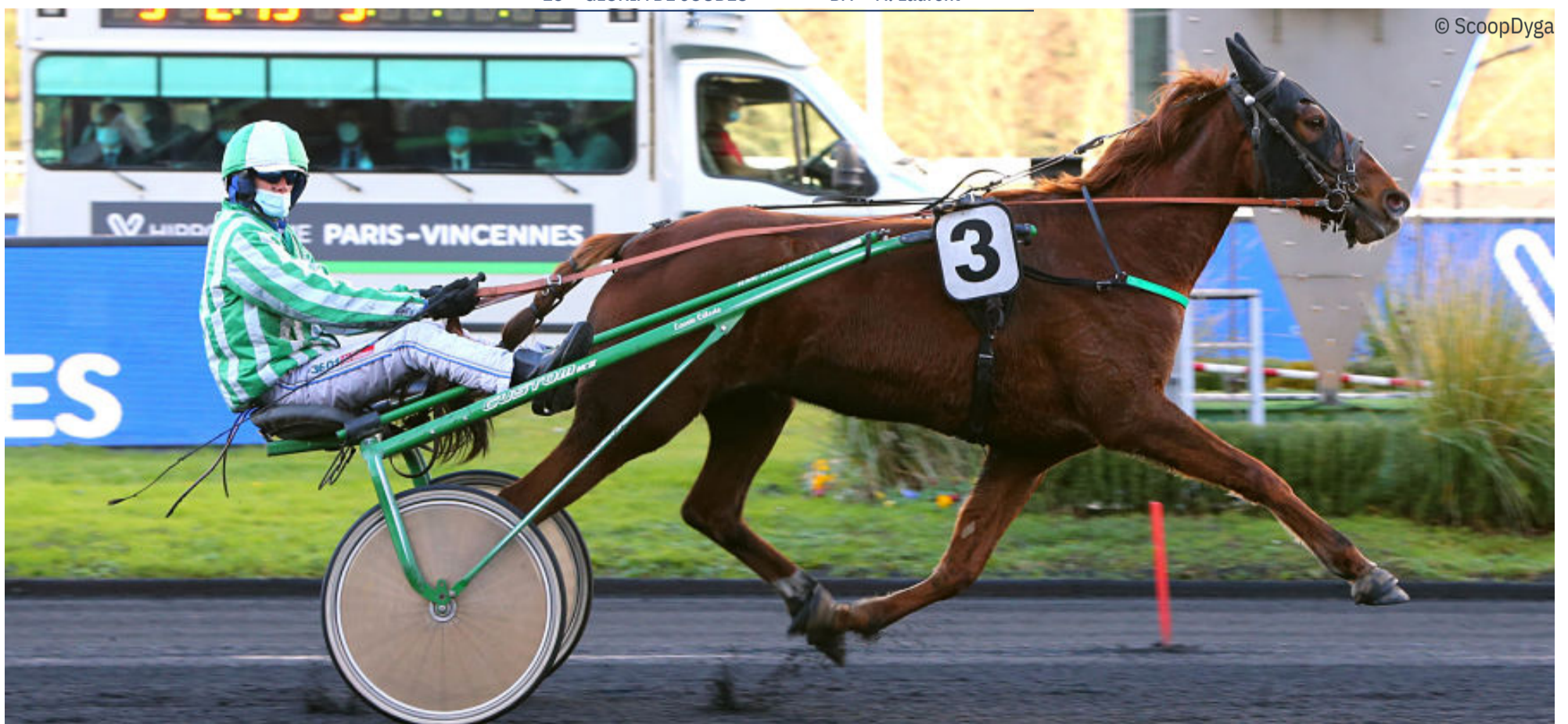
Garuncha Purple (614), lors de sa victoire à Vincennes le 15 décembre dernier. Elle est notre cheval de la réunion