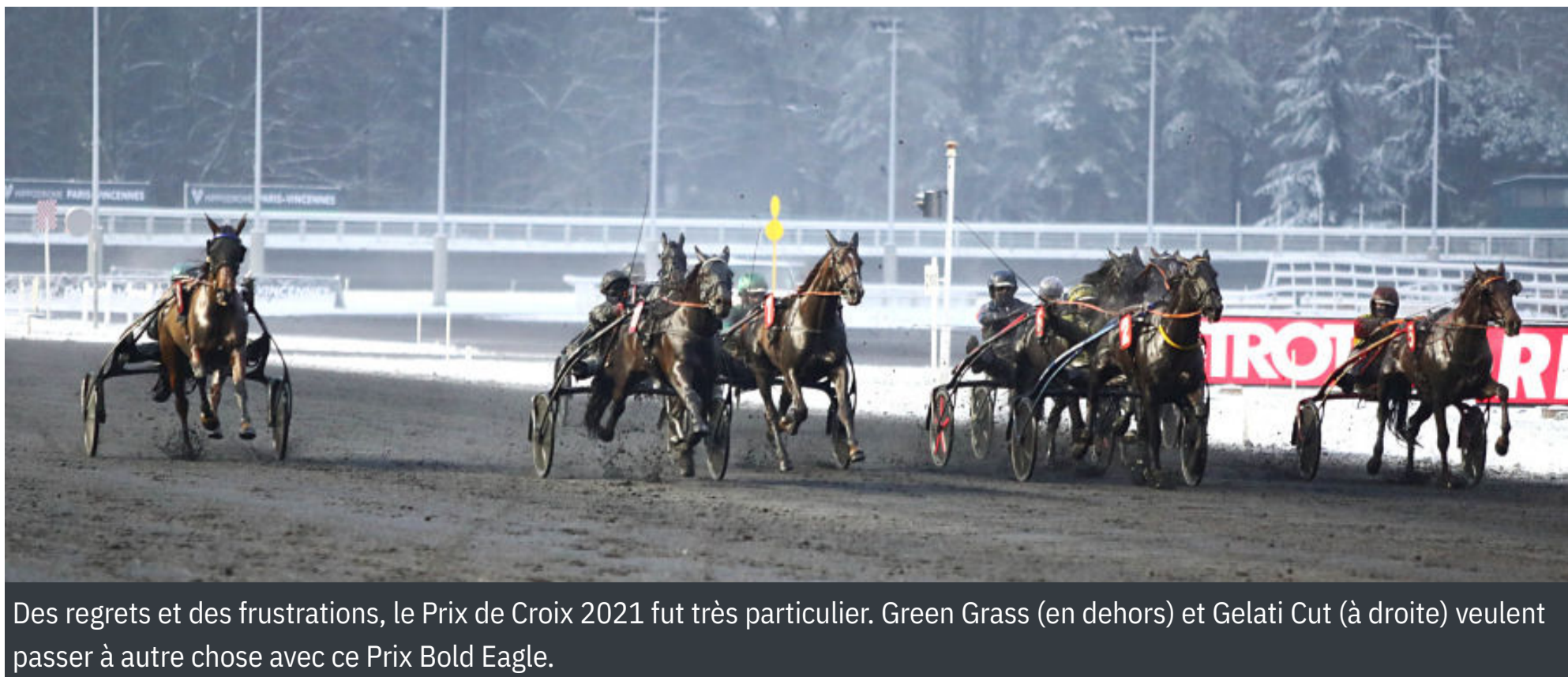
Des regrets et des frustrations, le Prix de Croix 2021 fut très particulier. Green Grass (en dehors) et Gelati Cut (à droite) veulent passer à autre chose avec ce Prix Bold Eagle.