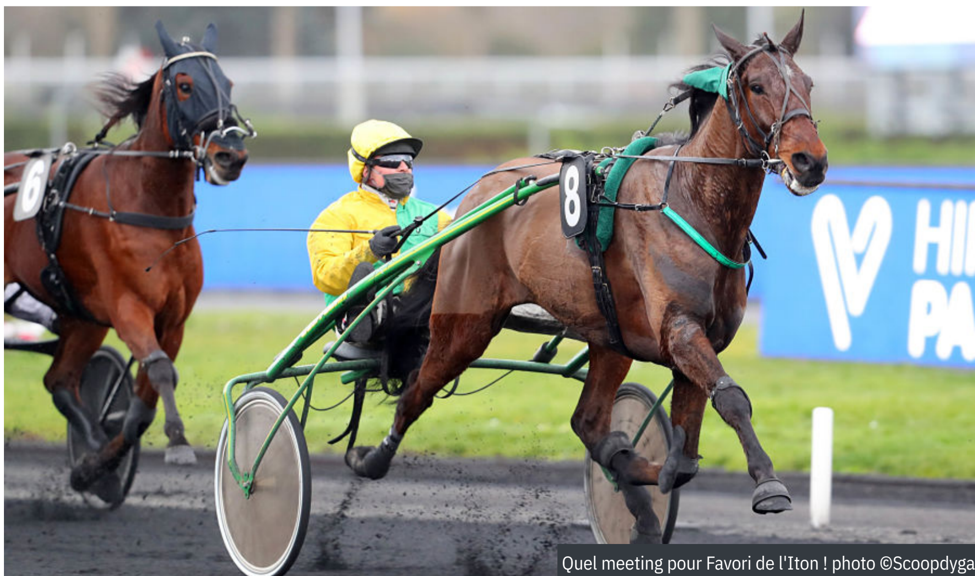
Quel meeting pour Favori de l'Iton !