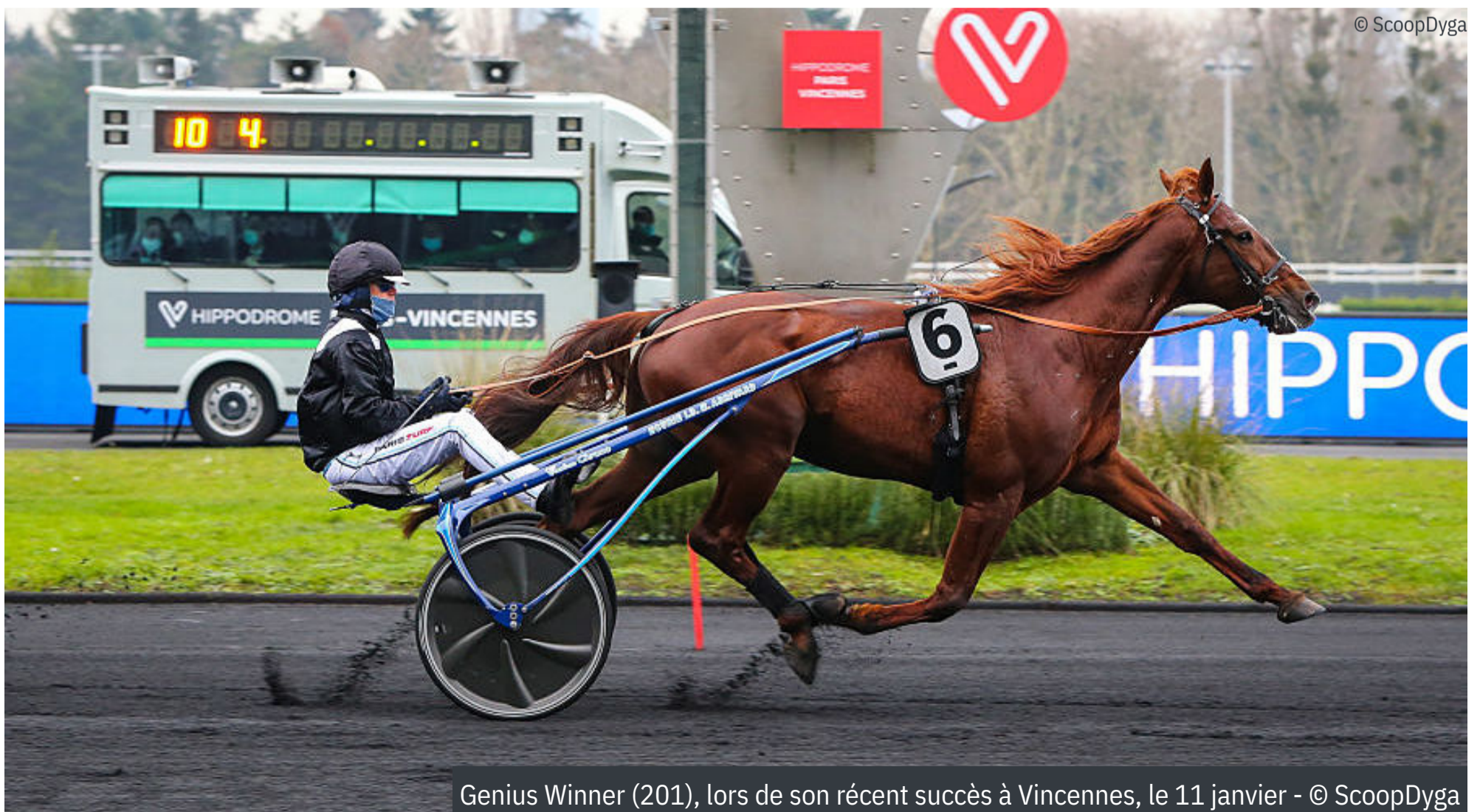
Genius Winner (201), lors de son récent succès à Vincennes, le 11 janvier