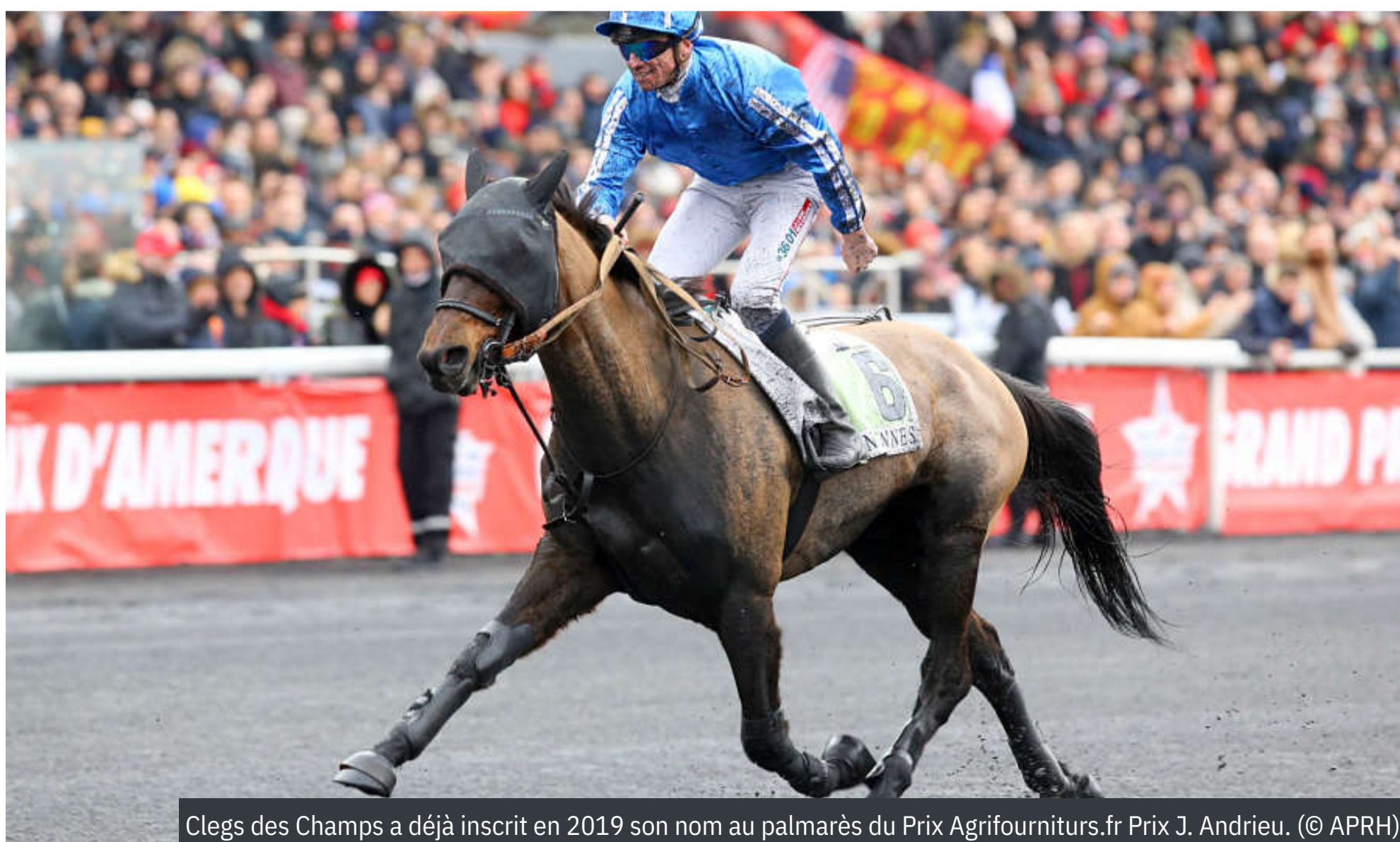
Clegs des Champs a déjà inscrit en 2019 son nom au palmarès du Prix Agrifournitures.fr Prix J. Andrieu.