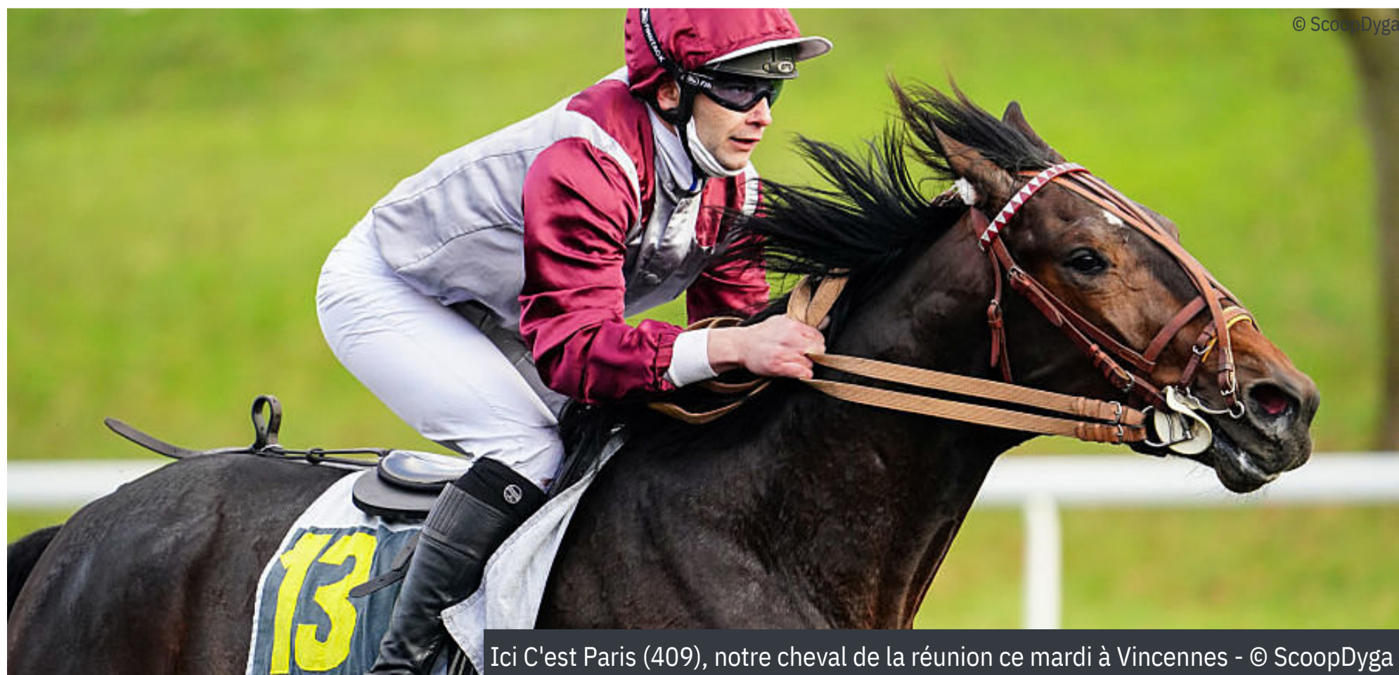
Ici C'est Paris (409), notre cheval de la réunion ce mardi à Vincennes