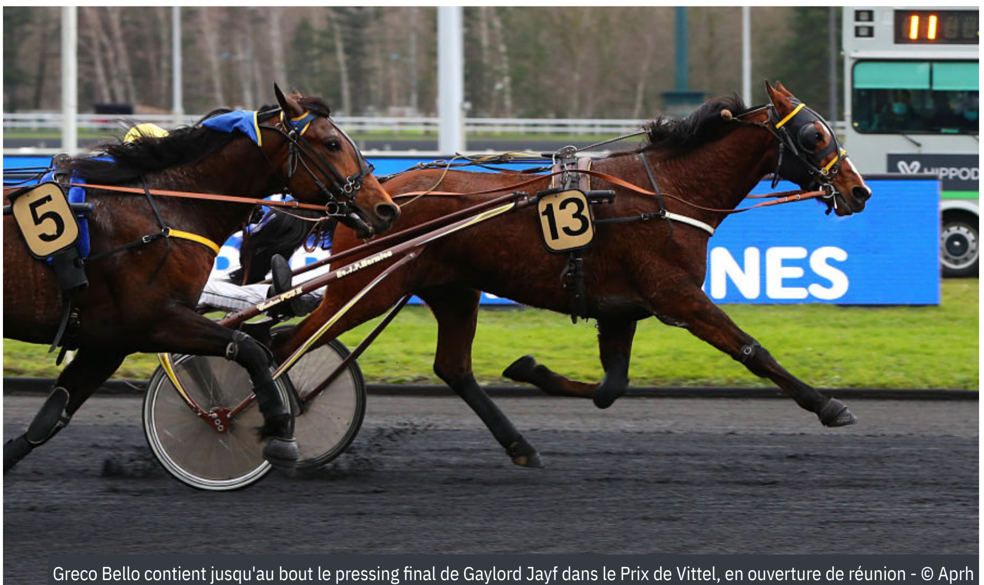
Greco Bello contient jusqu'au bout le pressing final de Gaylord Jayf dans le Prix de Vittel, en ouverture de réunion

4 e : In America - 5 e : I Love d'Amour - 6 e : Ideal Jibay - 7 e : Igor du Noyer