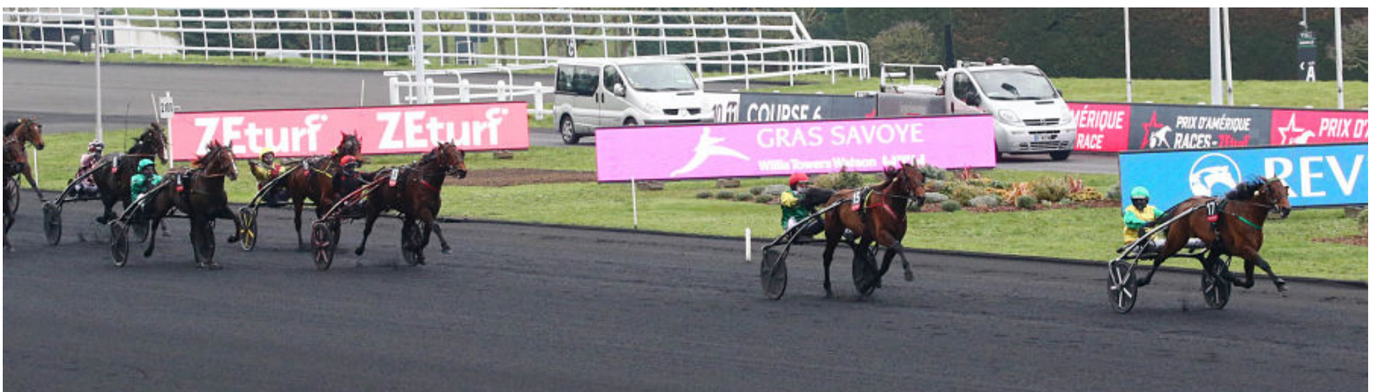
Un plan large de l'arrivée du Prix d'Amérique qui préfigure le classement final dans lequel Gu d'Héripé (casaque verte) prendra l'ascendant à la fin sur Délia du Pommereux pour la 3e place

Les huit premiers classés de ce Prix d'Amérique y ont enregistré leur nouveau record personnel sur le parcours des 2 700 mètres de la grande piste parisienne. Voilà sans doute la meilleure façon de faire vivre la 100e édition de la Legend Race encore longtemps dans les esprits. ■