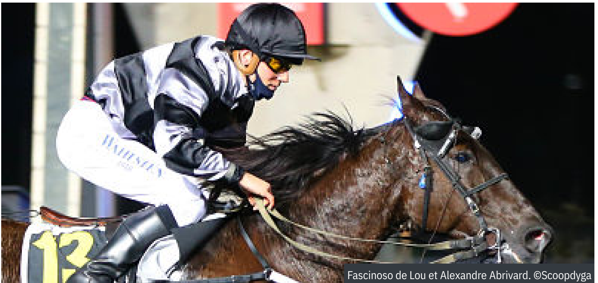
Fascinoso de Lou et Alexandre Abrivard.