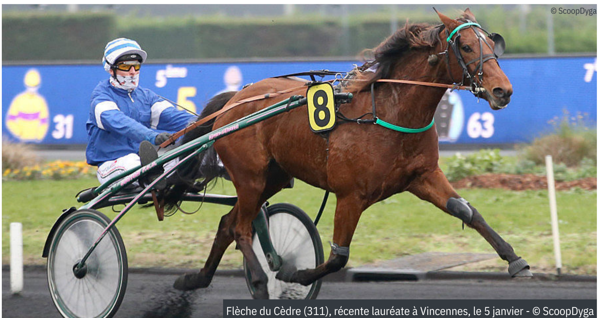
Flèche du Cèdre (311), récente lauréate à Vincennes, le 5 janvier