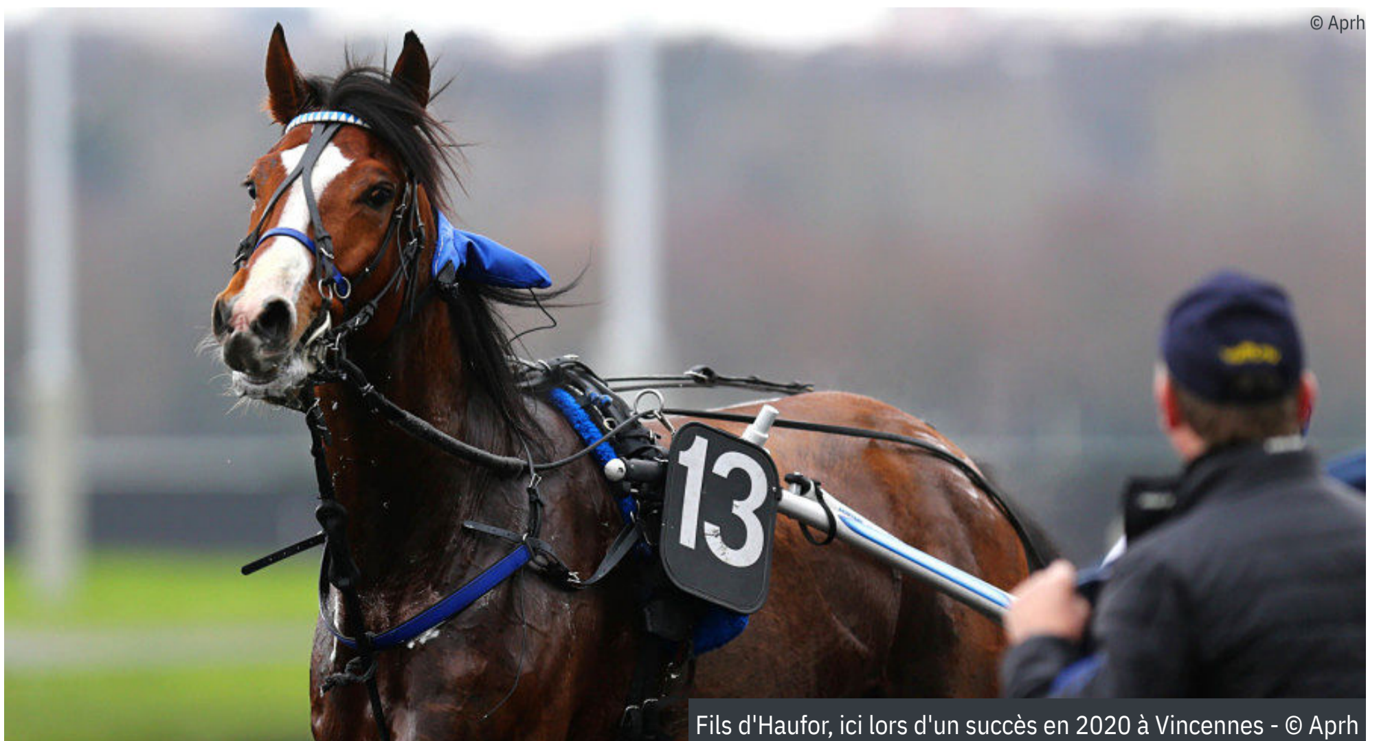
Fils d'Haufor, ici lors d'un succès en 2020 à Vincennes