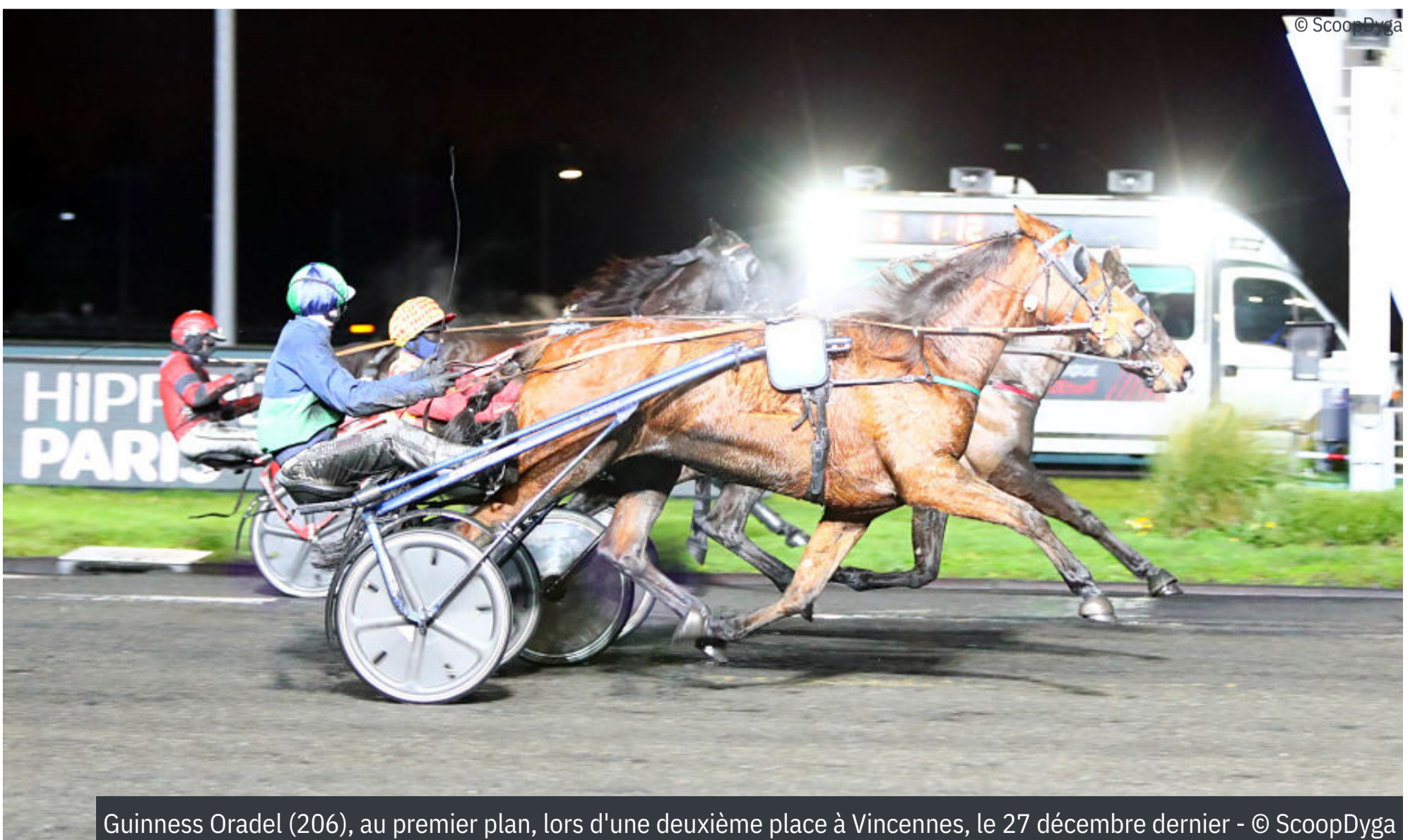
Guinness Oradel (206), au premier plan, lors d'une deuxième place à Vincennes, le 27 décembre dernier