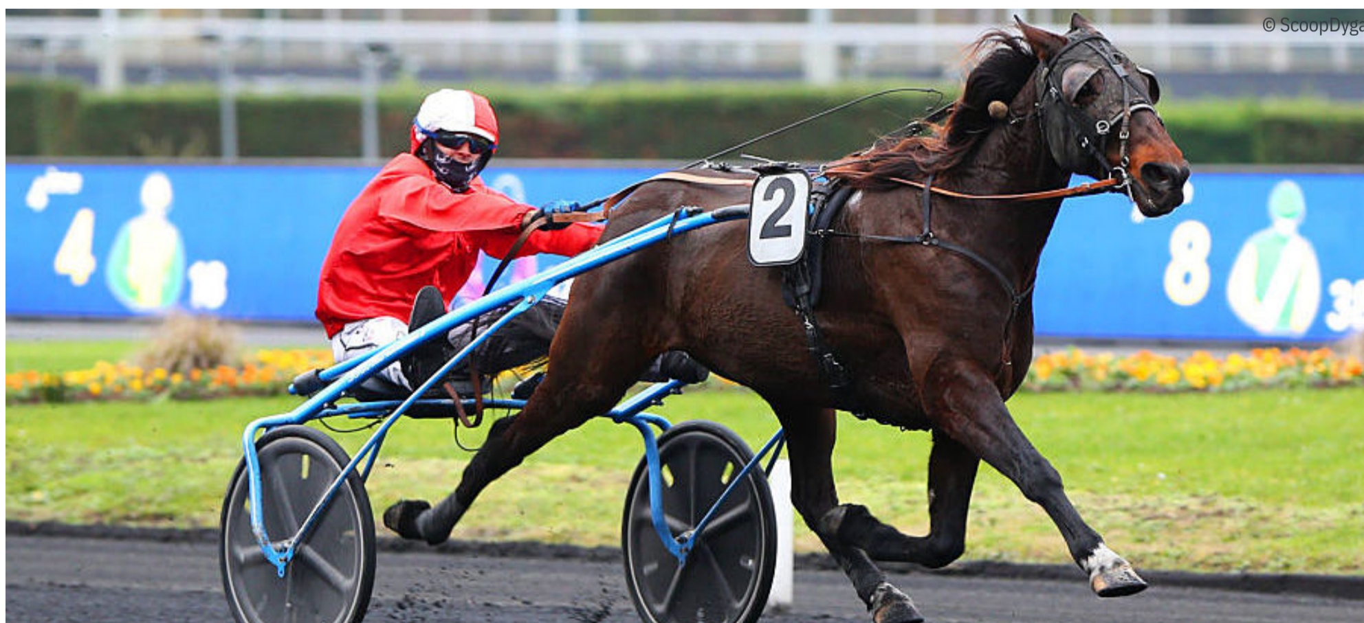
Belle Emotion (510), ici lors d'un succès à Vincennes en décembre, est bien engagée dans le Prix Jean Boillereau