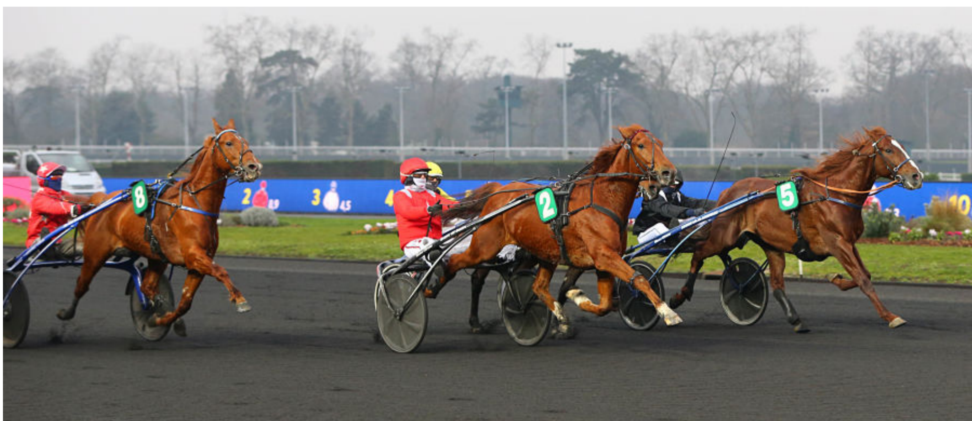
Guerch Seven (n°2) remporte le Prix du Bouscat le 8 février alors que Genius Winner (n°5) est deuxième et Gershwin de Chenu (n°8) quatrième