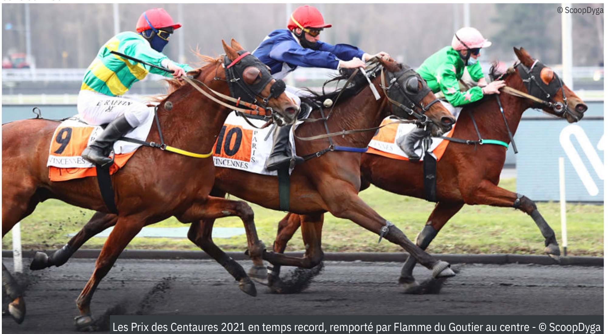
Les Prix des Centaures 2021 en temps record, remporté par Flamme du Goutier au centre - © ScoopDyga

“CLEGS DES CHAMPS, L'UN DES RECORD-HORSES DE L'HIVER.”