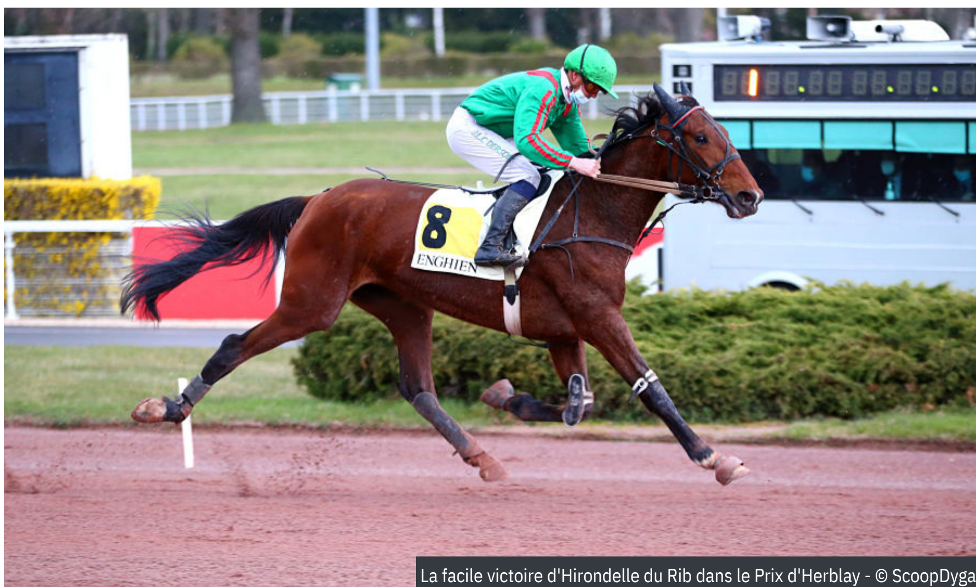
La facile victoire d'Hirondelle du Rib dans le Prix d'Herblay

4 e : Illico du Guesne - 5 e : Indien du Liamone - 6 e : It's Eagle Coglais - 7 e : Ivakir du Varlet