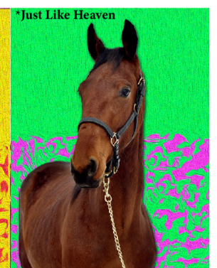
*Just Like Heaven