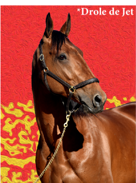
*Drole de Jet

Au regard des conditions d'exploitation de chaque cheval selon les accords entre les parties intéressées, il appartient à la personne qui perçoit la prime d'en reverser la quote-part correspondante aux associés ou colocataires des chevaux concernés, c'est-à-dire les personnes qui ont financé leur entretien et leur entraînement pendant la période d'arrêt des courses et sur la deuxième partie de l'année. ■