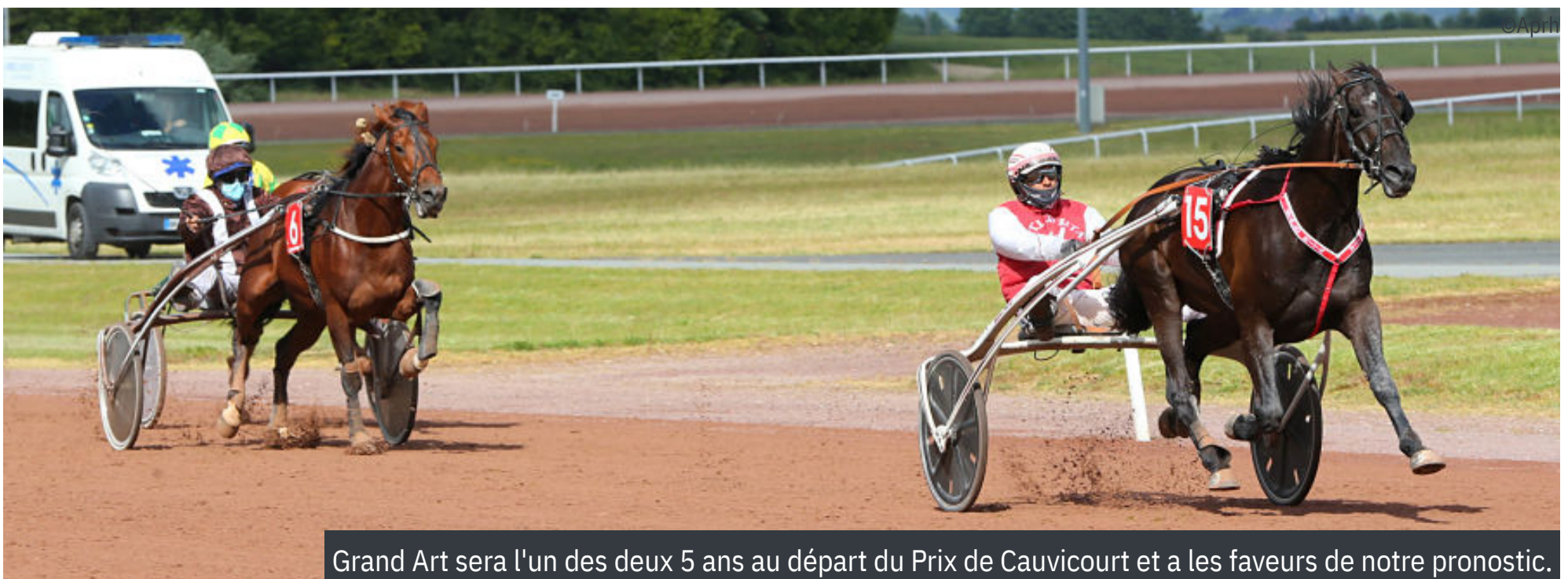
Grand Art sera l'un des deux 5 ans au départ du Prix de Cauvicourt et a les faveurs de notre pronostic.