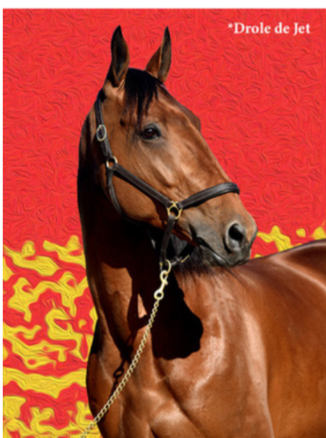
*Drôle de Jet