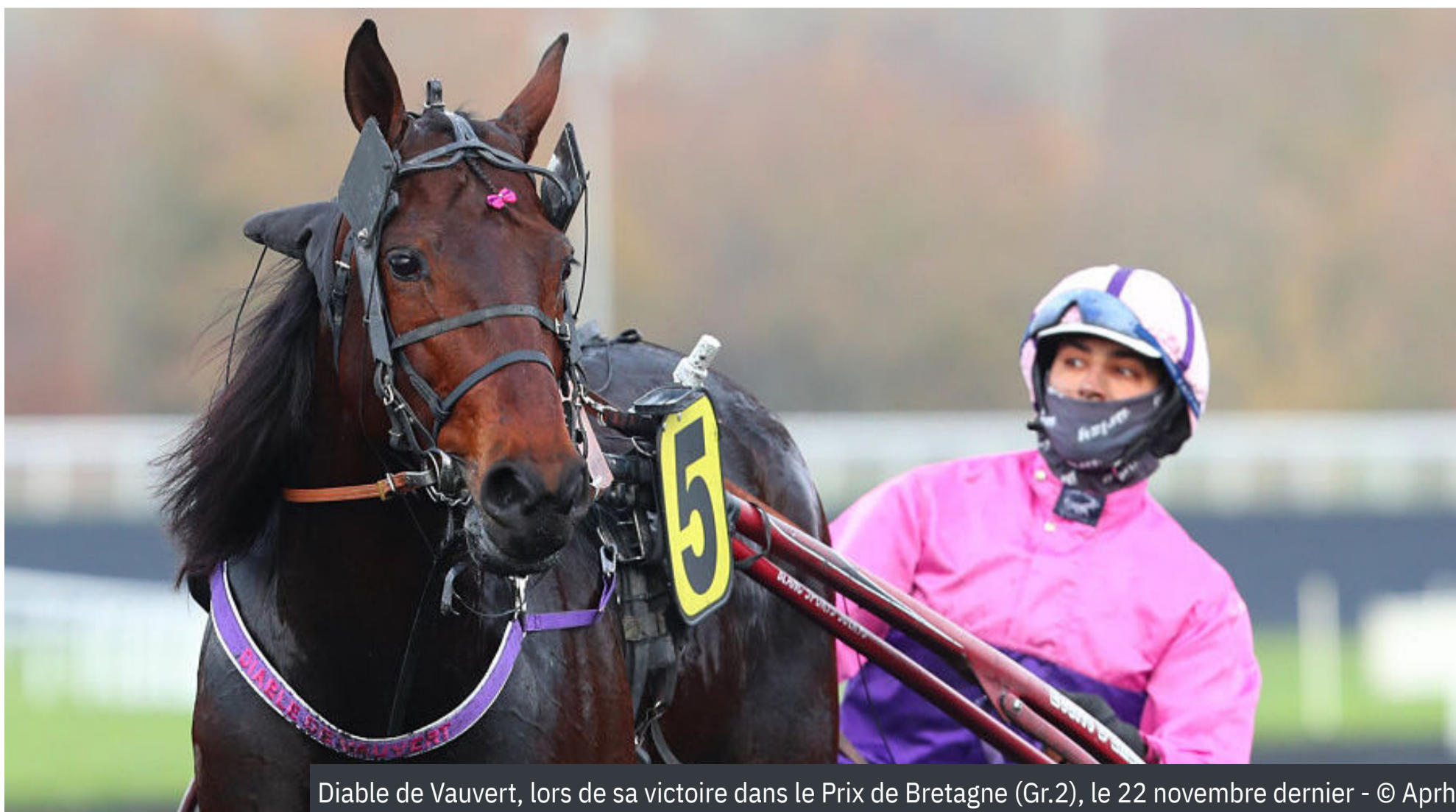
Diable de Vauvert, lors de sa victoire dans le Prix de Bretagne (Gr.2), le 22 novembre dernier