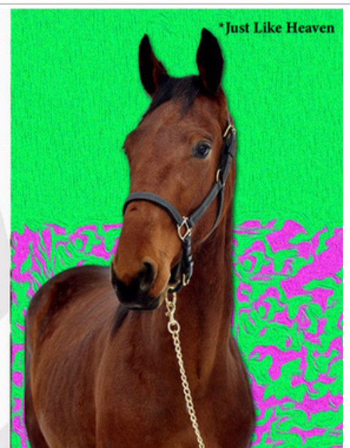
*Just Like Heaven