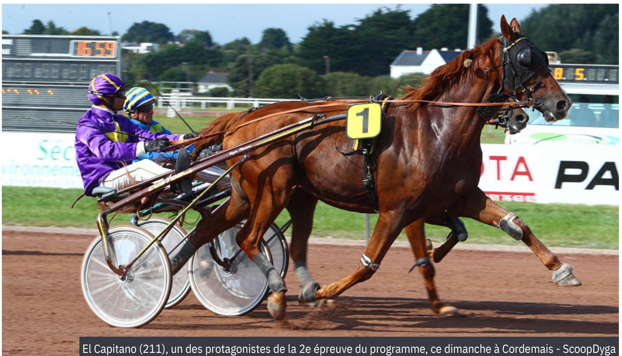
El Capitano (211), un des protagonistes de la 2e épreuve du programme, ce dimanche à Cordemais