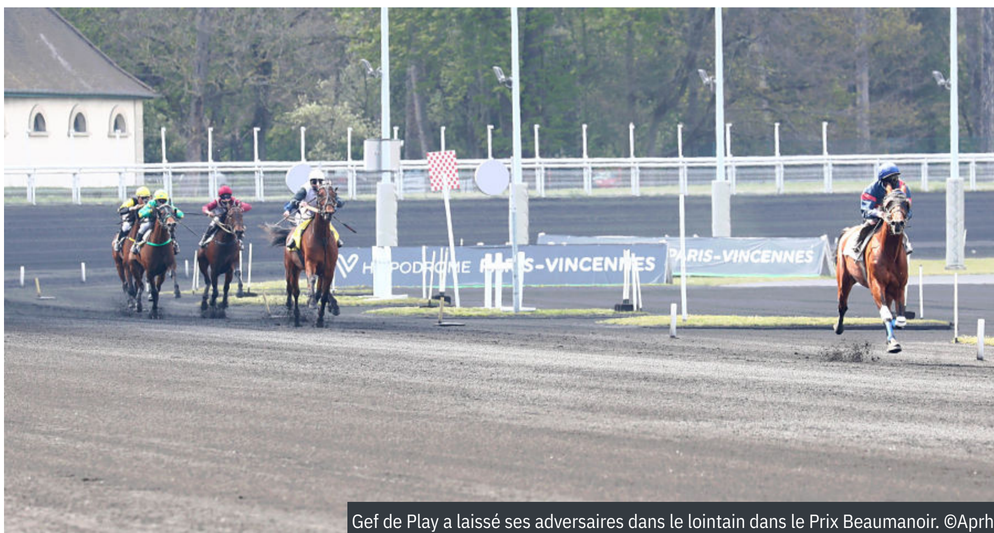
Gef de Play a laissé ses adversaires dans le lointain dans le Prix Beaumanoir.