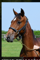
KING STALLION Ready Cash x Cara Mia Wood