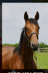
KOBAYASHI Face Time Bourbon x Come On Jet