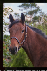
KRACK TIME D'ATOUT Face Time Bourbon x Topaze d'Atout