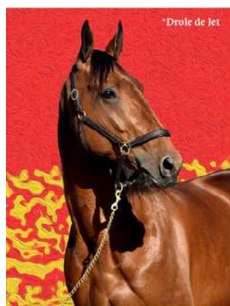
*Drôle de Jet

Féerie Wood ( Rockfeller Center ), Chica de Joudes (Jag de Bellouet) et Décoloration ( Prince d'Espace ) compléteront encore le champ des partantes du Prix de Paris. Chacune mérite considération, les deux premières pour leurs titres et la troisième pour son meeting ébouriffant.