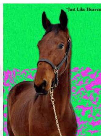
*Just Like Heaven