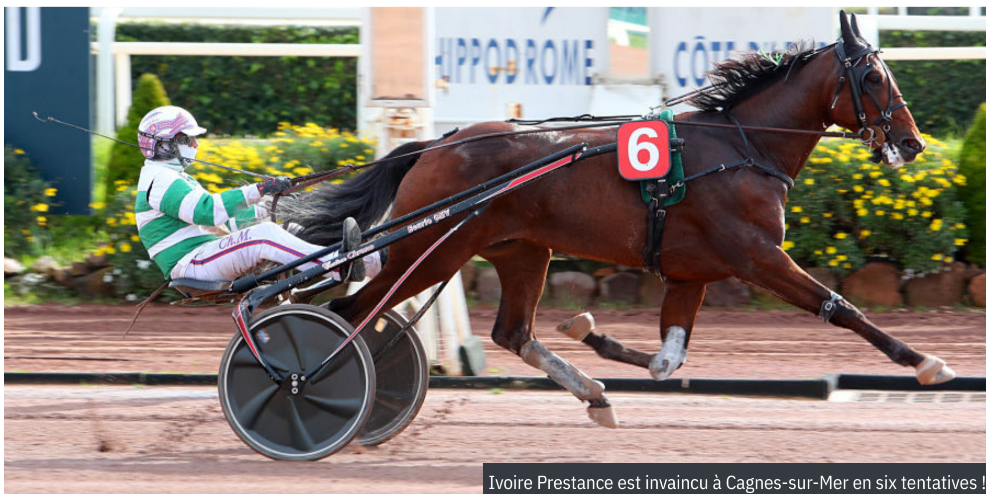
Ivoire Prestance est invaincu à Cagnes-sur-Mer en six tentatives !