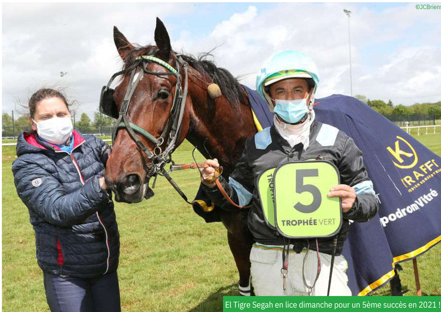
El Tigre Segah en lice dimanche pour un 5ème succès en 2021 !

bonne augure pour la suite du Trophée Vert. Pour moi, cela n'est pas un problème pour Détroit Ace de courir à une semaine d'intervalle. Sachant que je ne lui ai pas demandé l'impossible dans la phase finale dimanche dernier, il n'a pas eu une course éprouvante. Certes, le cheval est le moins riche du deuxième poteau, mais franchement vu ce qu'il a montré dans les étapes précédentes, cela ne fait pas du tout peur. Il faudra juste faire attention aux passages de route car il y en a sur l'hippodrome d'Agon-Coutainville. C'est un peu prétentieux de ma part mais je pense qu'il va falloir que ses adversaires soient forts pour le battre".