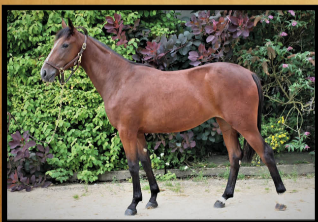
Femelle bai, née le 14/02/20 (génotype AA)