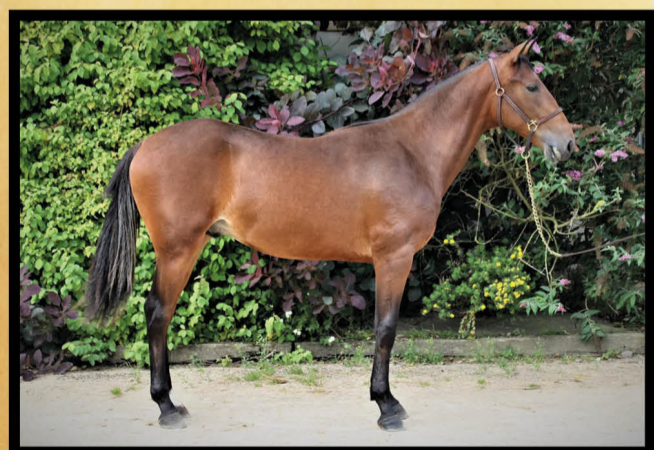
Mâle bai, né le 22/03/20 (génotype AA)