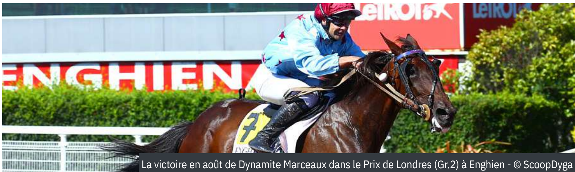
La victoire en août de Dynamite Marceaux dans le Prix de Londres (Gr.2) à Enghien

Le Prix Alfred Lefèvre faisait partie il y a peu des bonnes épreuves montées pour chevaux d'âge, doté du statut de Groupe 3. Cela était par exemple le cas en 2017, avec des conditions fermées à 905 000 €. Traders ( Ready Cash ) s'y imposait. En 2018, la course est devenue labellisée A passant à un seuil maximal de 465 000 € de gains. C'est Clegs des Champs qui a remporté cette édition. ■