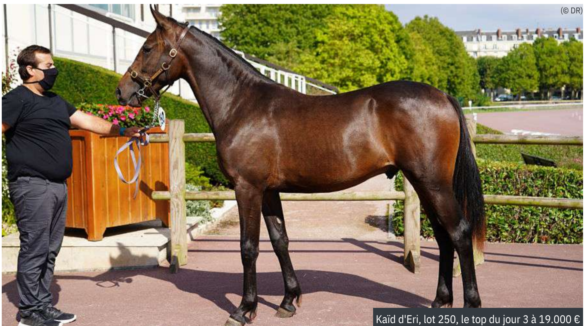
Kaïd d'Eri, lot 250, le top du jour 3 à 19.000 €