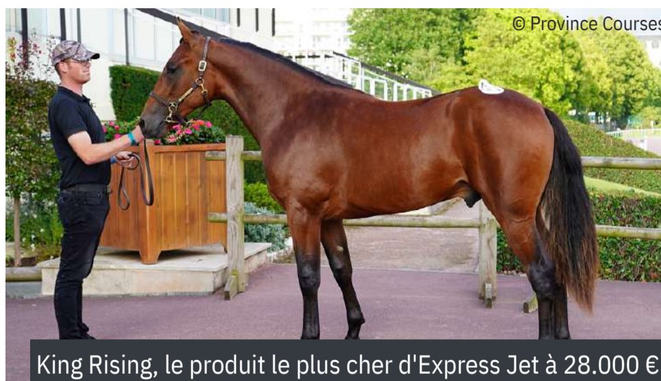
King Rising, le produit le plus cher d'Express Jet à 28.000 €

À droite, les tops des étalons réalisés lors du jour 2 lorsqu'ils sont significatifs. ■