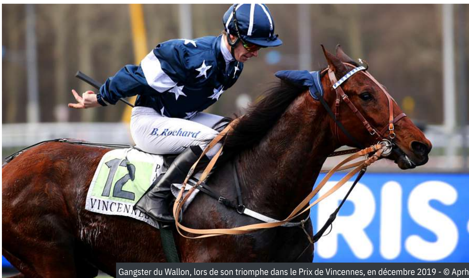
Gangster du Wallon, lors de son triomphe dans le Prix de Vincennes, en décembre 2019

Le quatuor d'âge compte deux 4 ans, Harrah Dibah ( Brillantissime ) et Hermine Girl ( Atlas de Joudes ), et de deux 5 ans, Ganay de Banville (Jasmin de Flore) et Gunilla d'Atout ( Ready Cash ). Ces deux derniers, au regard de leurs titres, s'annoncent les plus opposants les plus sérieux aux meilleurs 3 ans. ■