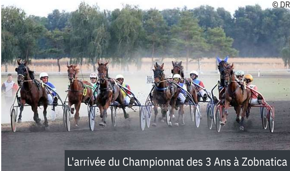
L'arrivée du Championnat des 3 Ans à Zobnatica