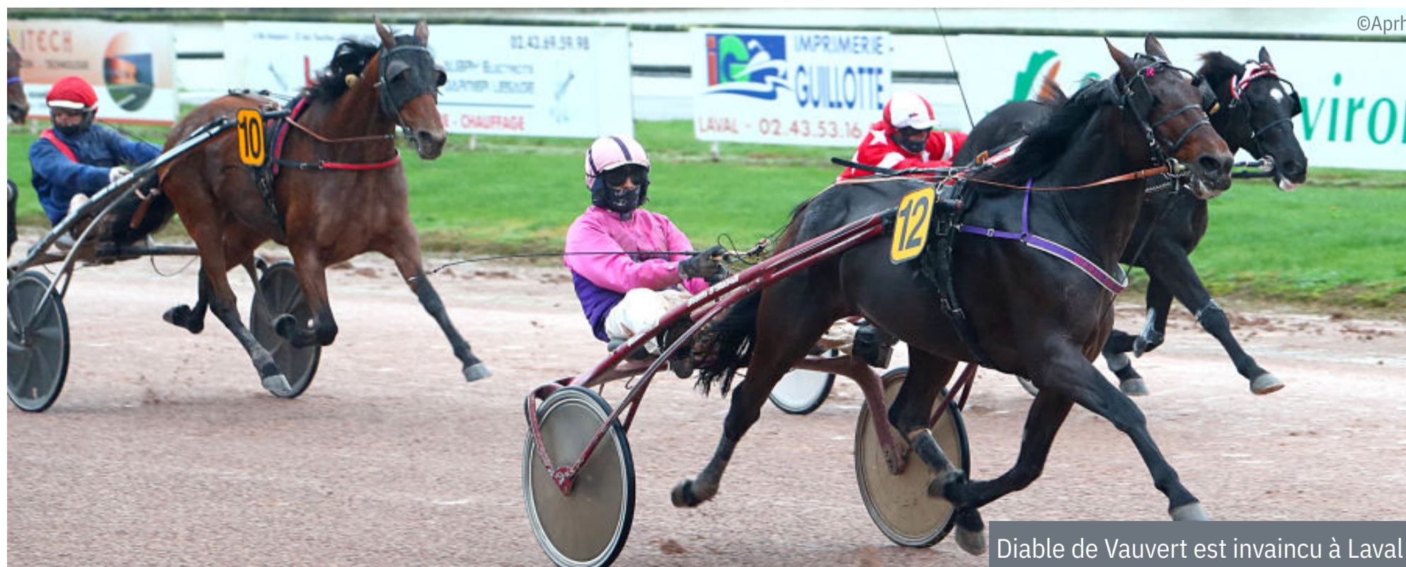
Diable de Vauvert est invaincu à Laval