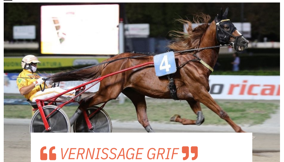
« VERNISSAGE GRIF »