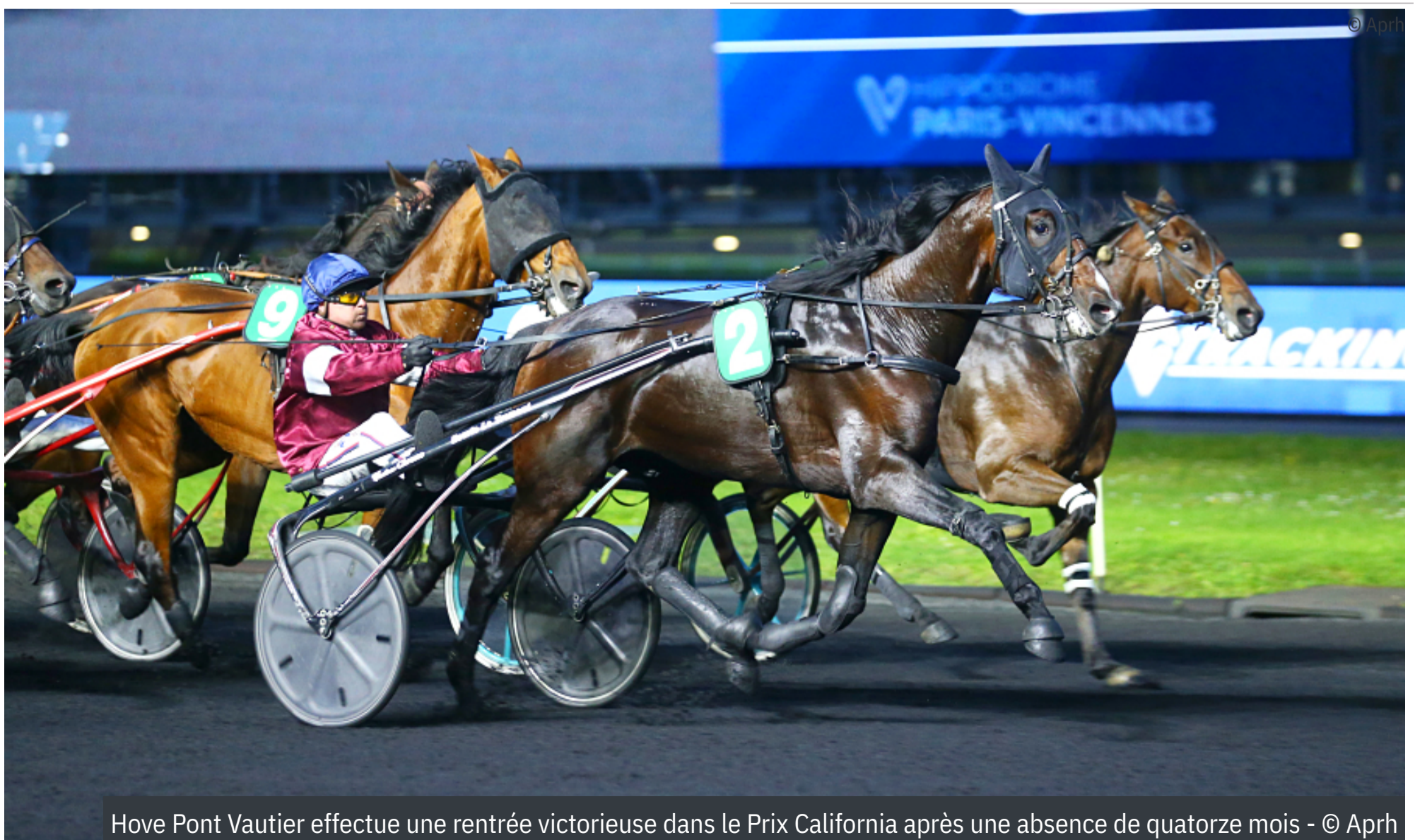
Hove Pont Vautier effectue une rentrée victorieuse dans le Prix California après une absence de quatorze mois

4 e : I Run Fighter - 5 e : Invictus du Mont - 6 e : Iciano - 7 e : Ideal des Liards