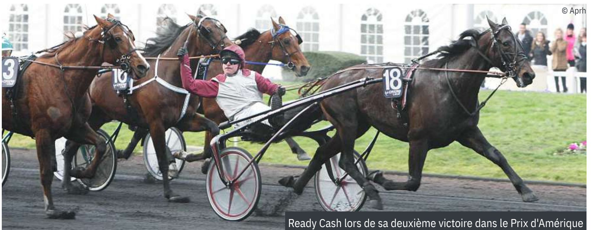
Ready Cash lors de sa deuxième victoire dans le Prix d'Amérique