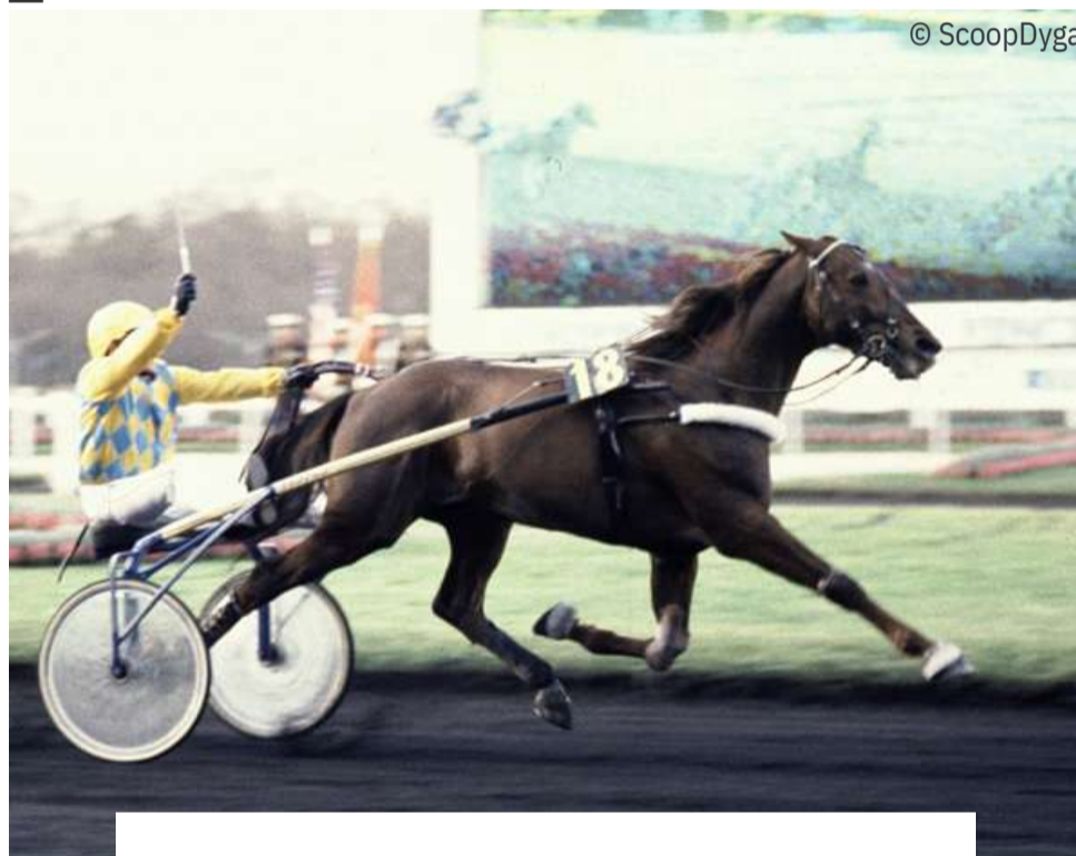
“ OURASI EN 1990 ”