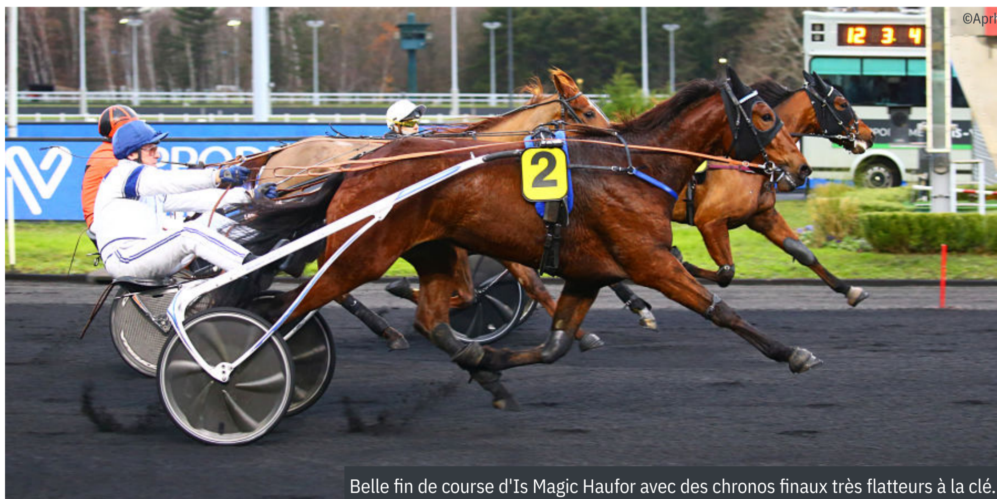
Belle fin de course d'Is Magic Haufor avec des chronos finaux très flatteurs à la clé.

* Tous les chronos affichés sont calculés en fonction de la distance parcourue réelle par chaque cheval / source tracking