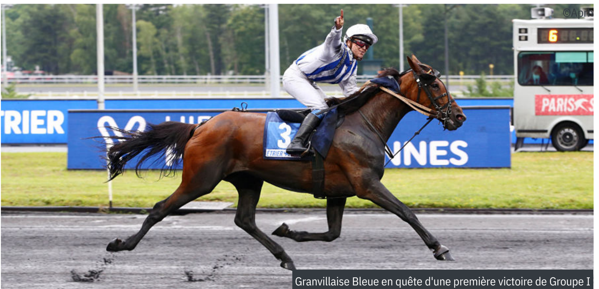
Granvillaise Bleue en quête d'une première victoire de Groupe I