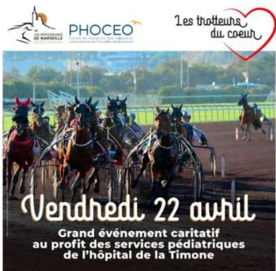
Réunion trot - Hippodrome de Pont-de-Vivoux