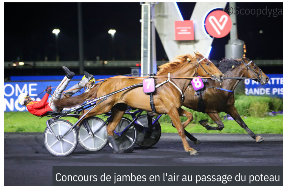
Concours de jambes en l'air au passage du poteau