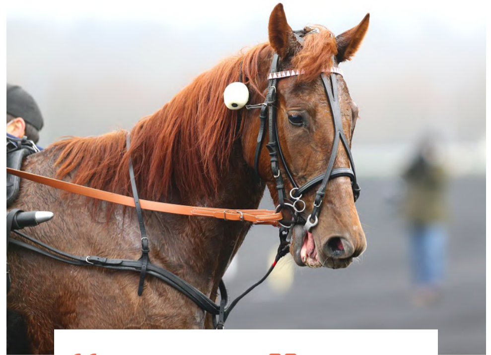
“ IDYLLE SPEED ”