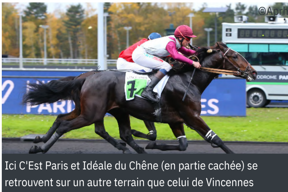
Ici C'Est Paris et Idéale du Chêne (en partie cachée) se retrouvent sur un autre terrain que celui de Vincennes