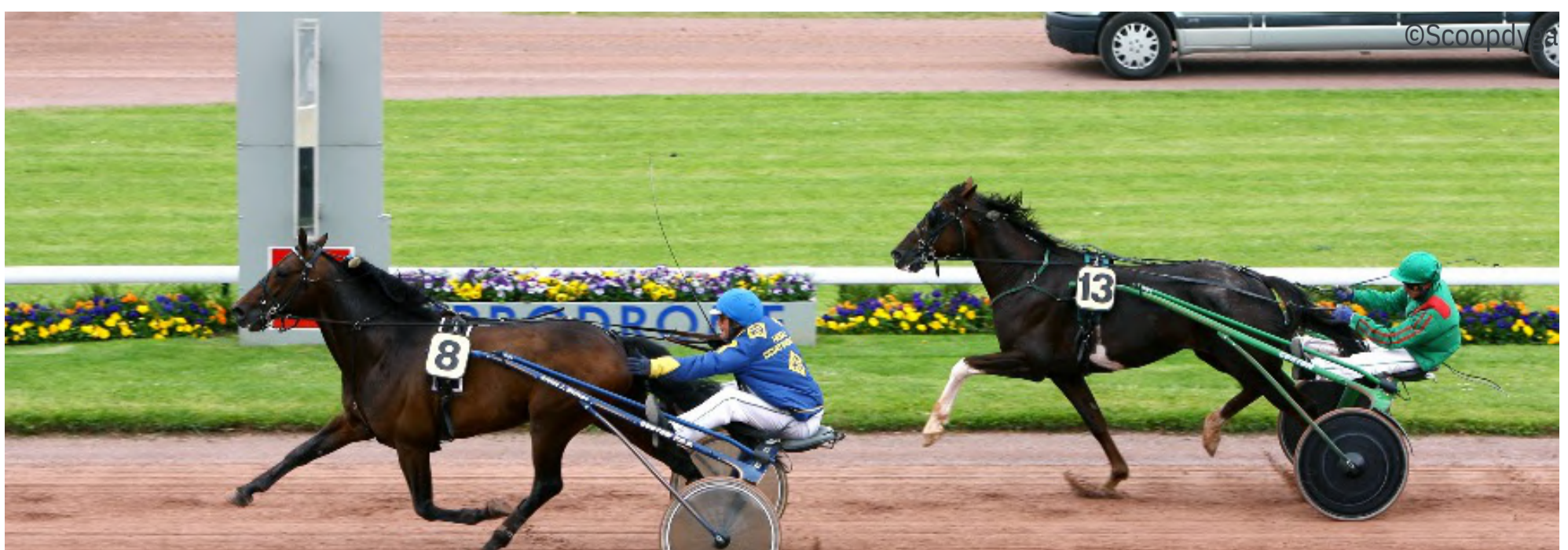
Unforgettable, le dernier vainqueur international du Prix des Ducs de Normandie. C'était il y a treize ans.

“ AMPIA MEDE SM ET REBELLA MATTERS FONT FACE À UN DOUBLE DÉFI STATISTIQUE : D'UNE PART LES FEMELLES ET D'AUTRE PART LES TROTTEURS ÉTRANGERS AU PALMARÈS ”