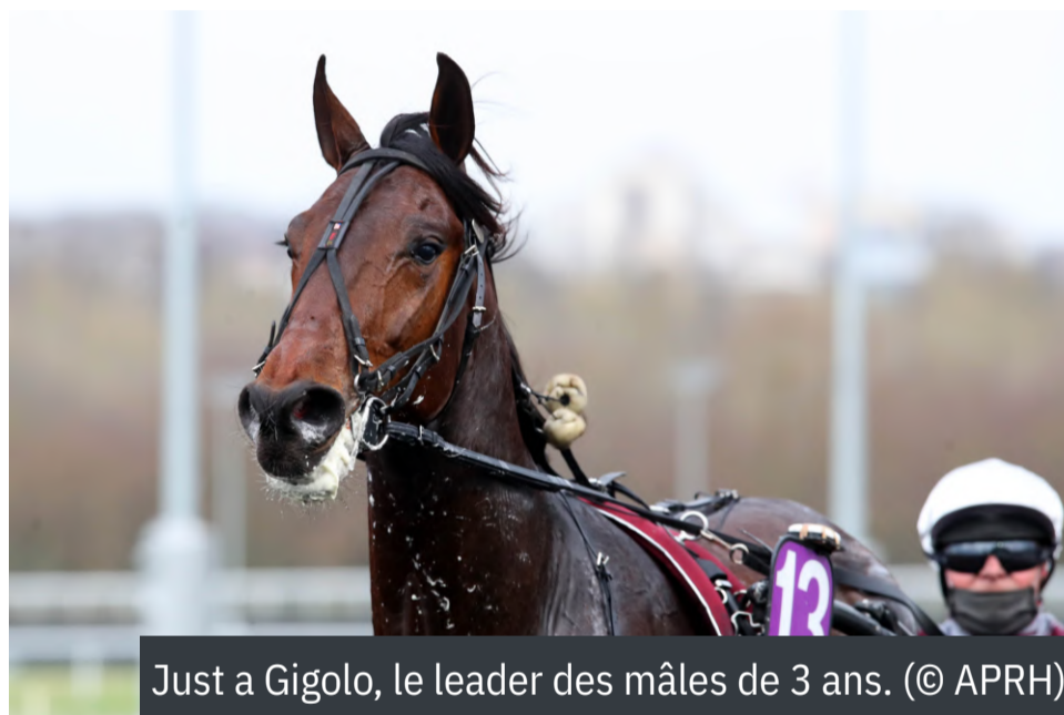
Just a Gigolo, le leader des mâles de 3 ans.