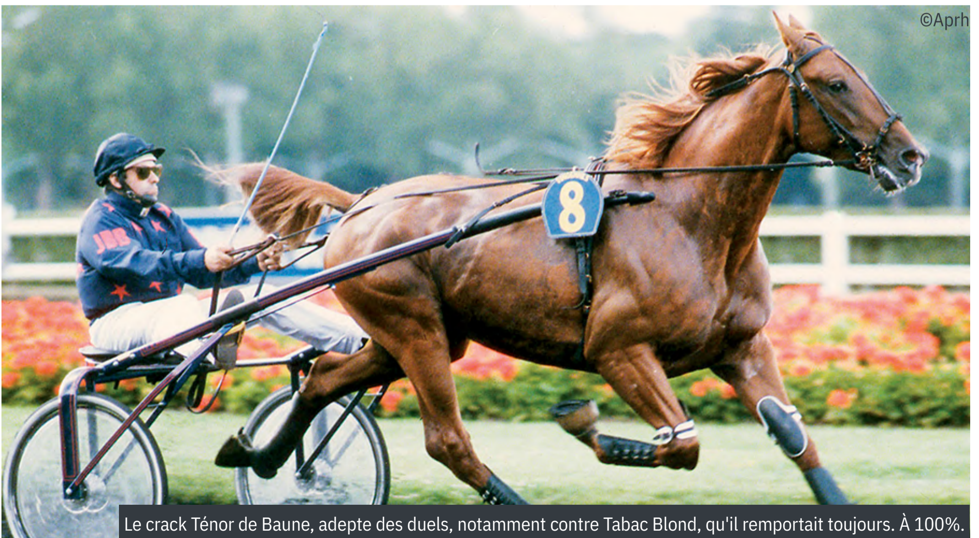
Le crack Ténor de Baune, adepte des duels, notamment contre Tabac Blond, qu'il remportait toujours. À 100%.