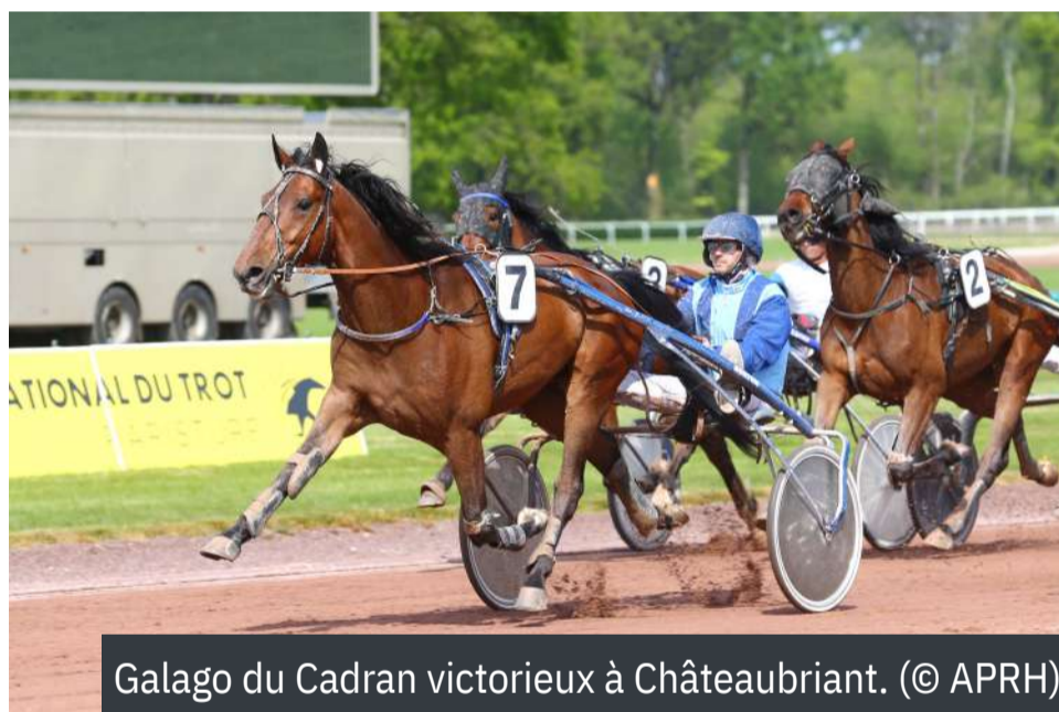
Galago du Cadran victorieux à Châteaubriant.

BÉNÉFICIEZ D'UNE VISIBILITÉ OPTIMALE POUR VOTRE COMMUNICATION