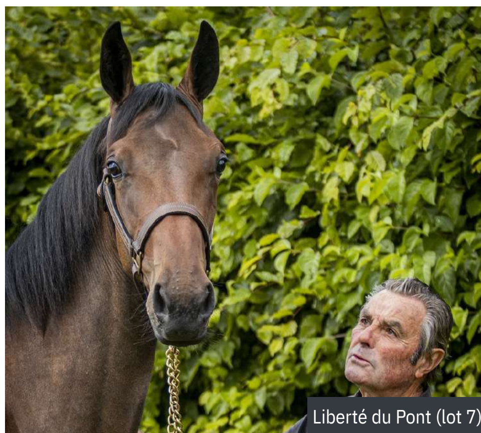
Liberté du Pont (lot 7)

Inspection sur rendez-vous, du lundi au vendredi, à partir de 14h. Contacts : Jean-Yves Rayon au 06.15.10.35.36 ou Fabienne Sez nec au 06.21.76.41.11.