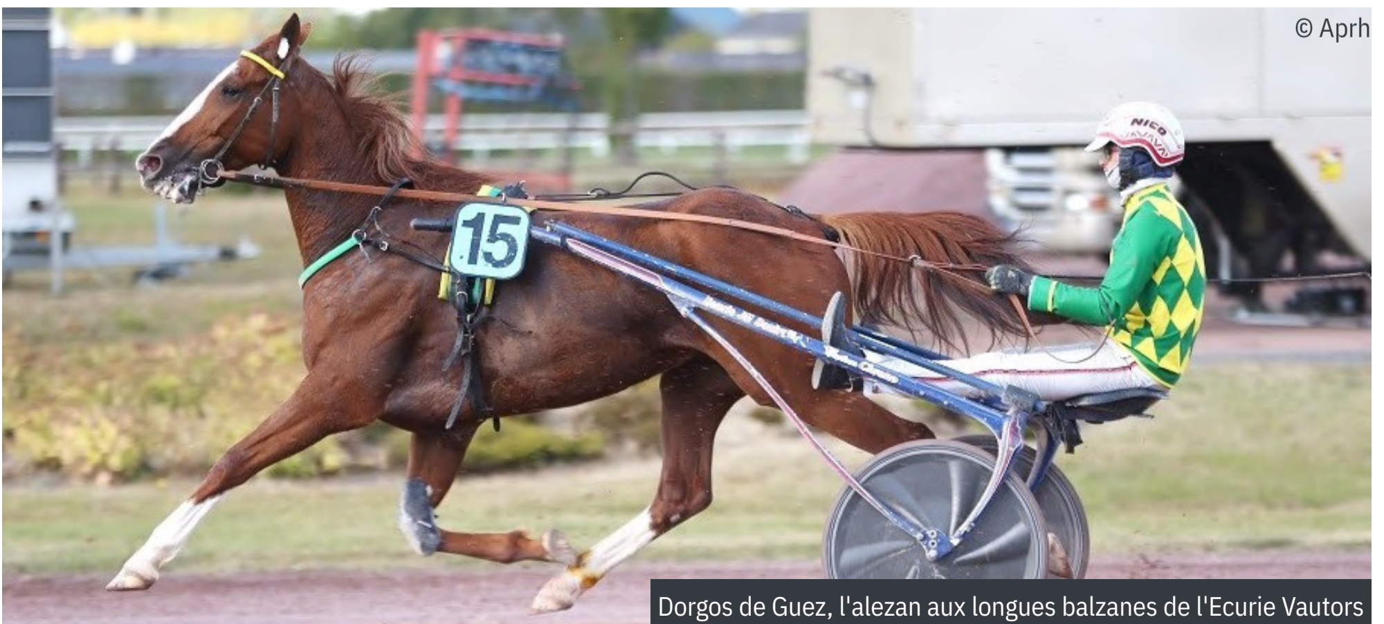
Dorgos de Guez, l'alezan aux longues balzanes de l'Ecurie Vautors