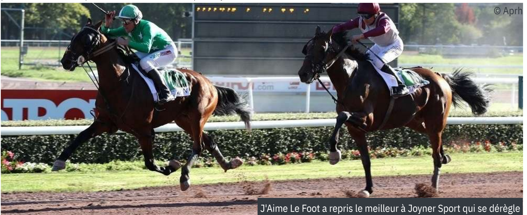
J'Aime Le Foot a repris le meilleur à Joyner Sport qui se dérègle

4 e : Jelyson - 5 e : Jalisco Fligny - 6 e : Jorgos de Guez - 7 e : Jubile Prior