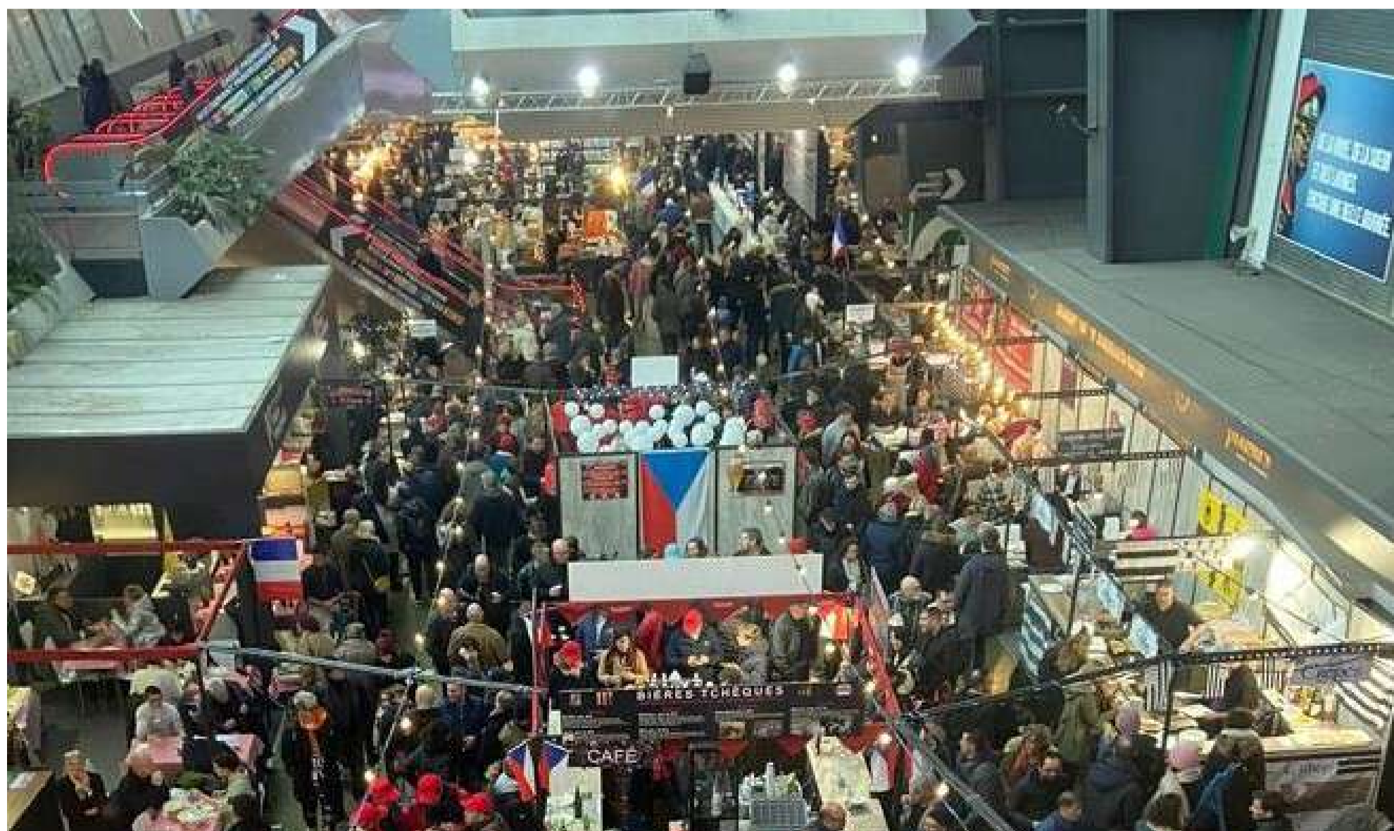
Les régions, mais aussi quelques pays étrangers, étaient à l'honneur ce dimanche dans le grand hall de Vincennes

* Tous les chronos affichés sont calculés en fonction de la distance parcourue réelle par chaque cheval / source tracking