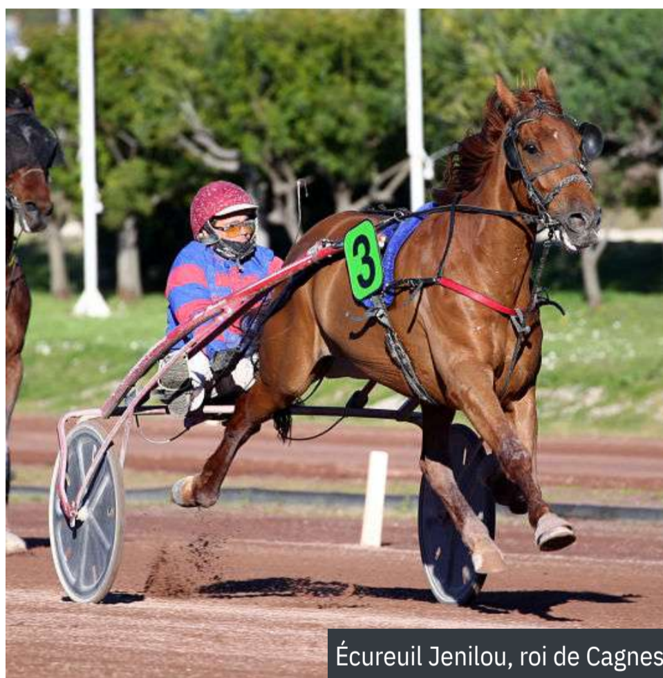
Écureuil Jenilou, roi de Cagnes