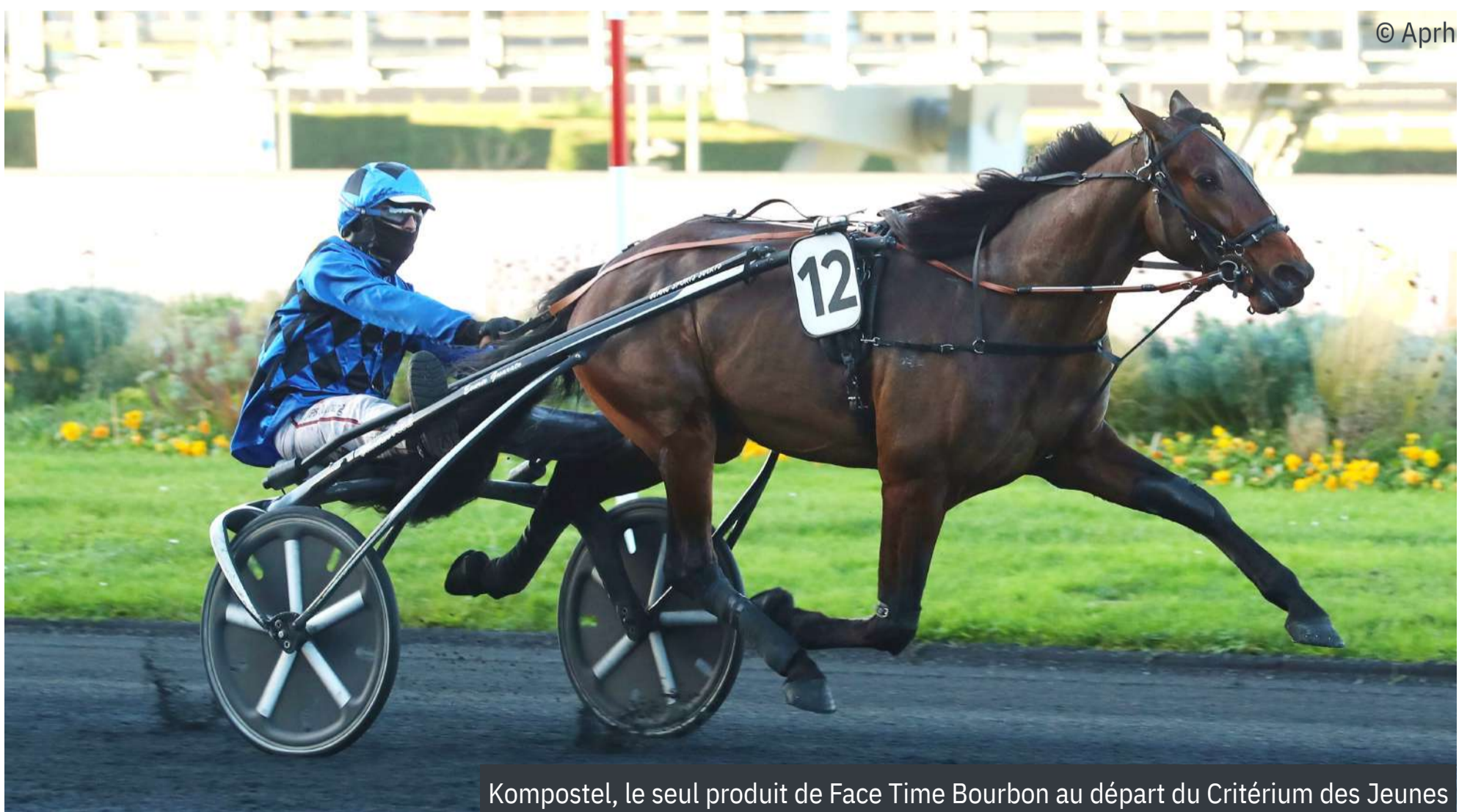
Kompostel, le seul produit de Face Time Bourbon au départ du Critérium des Jeunes