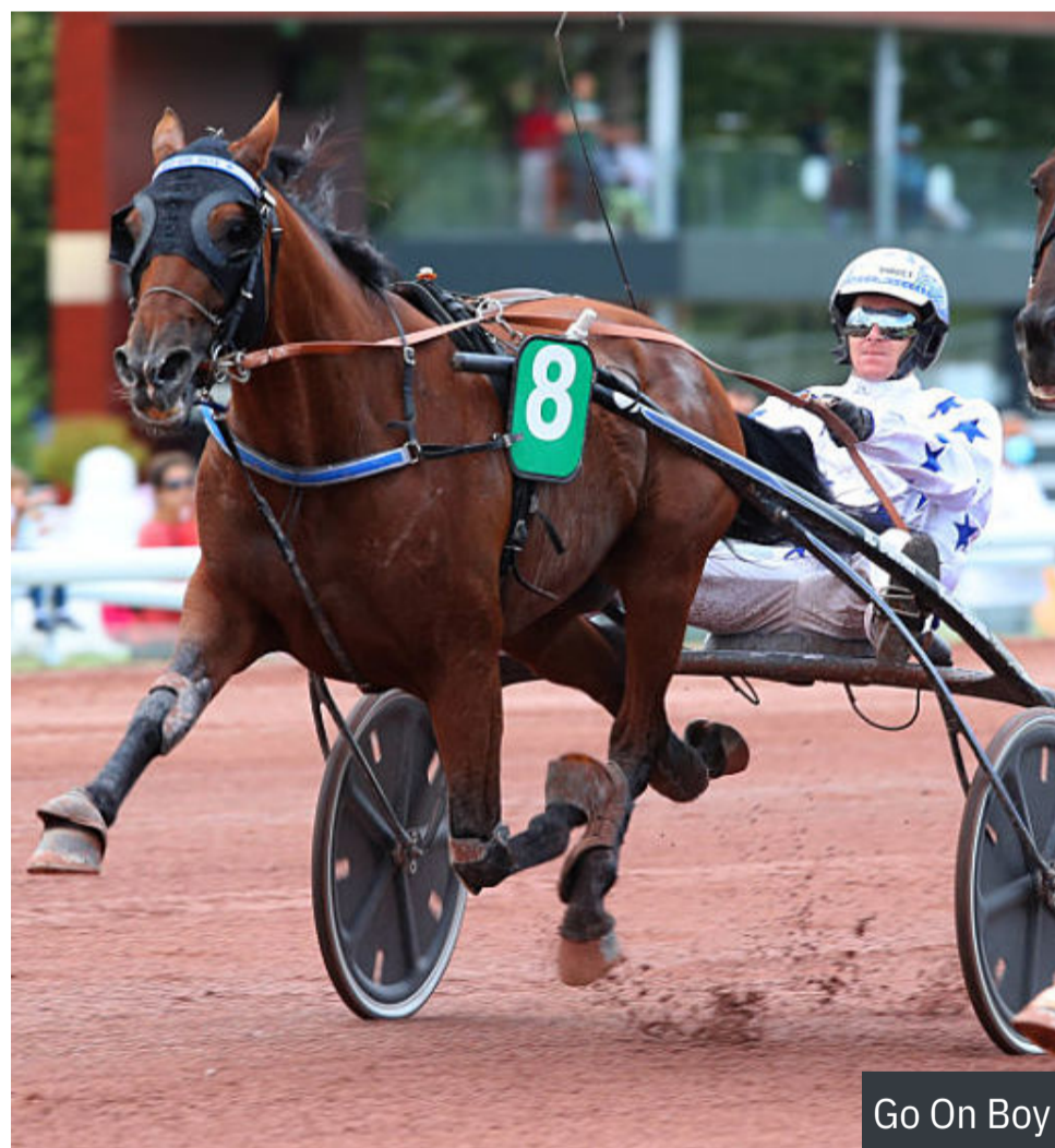
Go On Boy

Ses meilleures références sont maintenant au monté et sa tâche semble ici bien délicate. Escalade sur la route retour en Italie.