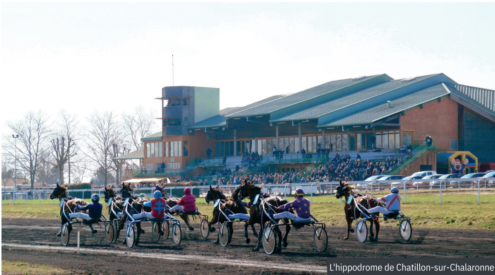
L'hippodrome de Chatillon-sur-Chalaronne